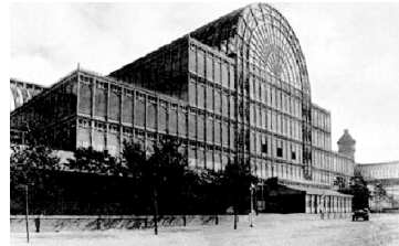
تصویر شماره ۱: قصر بلورین

می خاست. از این زمان به بعد نسل جدید برای اعلام موجودیت خود و رهایی از خستگی ملال آور معماری مدرن به هر دری زد و نهایتاً به عوامل سازه و فن آوری به عنوان امکانات بالقوه در یافتن راه حل های تازه نگریست و آنها را به کار گرفت. از جمله مصالحی نیز که مورد توجه قرار گرفت آهن بود. پس از انقلاب صنعتی، آهن به روش صنعتی تولید شد و به میزان زیاد در دسترس قرار گرفت و اهمیت یافت. چدن و بتن مسلح نیز به عنوان مصالح جدید ساختمانی پا به عرصه ساخت و ساز گذاشتند به طوریکه وجود این مصالح مقاوم به میزان فراوان با قابلیت کششی بالا، زمینه مساعدی را در طراحی بسیاری از بناهای بزرگ با استراکچر وسیع فراهم ساخت (تصاویر ۱ و ۲).