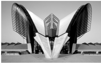
تصویر شماره ۳: فرودگاه لیون اثر کالاتراوا

به اندازه محاسبات سازه ای ارزشمند و حیاتی هستند. سازه های زیبا و باشکوه و تخیلات و احساسات پر شور را در بیننده به وجود می آورند. او در پی خلق فرم های نوینی است که بر مبنای دانش فنی شکل گرفته است. دریافت علمی و دانش فنی در کنار خلاقیت های کالاتراوا به آثار او جلوه ای خاص بخشیده است. این خلاقیت یادآور ارتباط تنگاتنگ علم و هنر است. در حقیقت فن در آثار کالاتراوا برای تجلی و بیان مباحث سازه ای به کار گرفته می شود و بدین ترتیب جسارت سازه ای معمار با بیان ساده و روان معماری او عجین می شود و اثر به صورت ترکیبی موزون از اصول فیزیکی ساختاری و زیبایی تجلی می یابد و اتفاقاً همین اصول سازه ای است که در آثار کالاتراوا تکلیف فرم را تا حد زیادی مشخص می کنند (تصاویر ۳ و ۴).