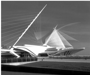
تصویر شماره ۴: موزه هنری میلواکی اثر کالاتراوا