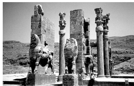
تصویر شماره ۵: تخت جمشید

در معماری حکومتی دوران هخامنشی، تامین انواع فضاهای مورد انتظار بر اساس سیستم های سازه ای ممکن صورت می گیرد. ایجاد فضاهایی که دارای ابعاد مختلف در طیف خرد تا کلان و ارزش ها و کارکردهای متفاوت هستند با استفاده از سیستم های سازه ای به ارث رسیده از گذشته گاه گزینش شده و آگاهانه (انتخاب نوع سیستم بر اساس کاربرد و استفاده) و گاهی نیز تجربه شده (تعمیم کاربرد سیستم سازه ای کارآمد) به ویژه خلاق، محقق می گردد. شکل سیستم سازه ای شامل ترکیب تیر و ستون و دیوار باربر، اگر چه ریشه در روش های ساختمانی ماقبل خود دارد، در عین حال واجد ویژگی هایی نو و منحصر به فرد است، که در مجموع در راستای هماهنگی با فرهنگ فضا قرار می گیرد. ایجاد تعالی، شوکت و عظمت در دو جنبه معنوی و به ویژه دنیوی، به زبان رمز، عامل تشخیص فضای معماری محسوب می شود که به واسطه سیستم سازه ای، شکل جسمانی خود را می یابد. سیستم سازه ای نیز ضمن اتکا بر زبان سازه ترکیبی از تیر و ستون و دیوار باربر از چوب و سنگ یا چوب و سنگ و خشت خام در جستجوی یافتن روش ممکن برای بیان فضای مورد نظر، مبتنی بر زبان رمزی می شود (تصویر ۵).