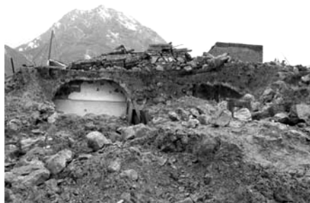
تصویر شماره (۲)

دانست (معماری، ۱۳۷۲، ۳۱). آمار و احتمالات مهندسی نشان می‌دهد به طور متوسط هر چهار سال یکبار در ایران یک زلزله شدید رخ می‌دهد که پیامد آن، تخریب ۹۷٪ واحدهای روستایی و آسیب کلی ۷۹٪ واحدهای شهری در منطقه وقوع زلزله خواهد بود (بیات، ۱۳۸۲، ۳۶-۴۱).