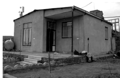
تصویر شماره (۸)

در منطقه مورد مطالعه، موارد نادری از تلاش در جهت اجرای شناژ مشاهده می‌شود ولی شواهد نشان می‌دهد دست اندرکاران ساخت و ساز در منطقه از کیفیت اجرای صحیح شناژ هم اطلاع چندانی نداشته‌اند. در چند مورد مشاهده شده است که برای پر کردن شناژ به جای بتن از آجر و ملات استفاده شده است. در اکثر موارد خاموت‌ها با فواصل بسیار زیاد از یکدیگر و به تعداد خیلی کم اجرا شده‌اند. در برخی موارد، کیفیت بتن استفاده شده در شناژها آنقدر پایین است که با فشار دست خرد می‌شود (تصویر شماره ۷). در شناژها، پوشش بتن که باید میلگردهای شناژ را ببوشاند، خیلی ضعیف و نازک اجرا شده است. شناژها در اکثر موارد اتصال افقی با یکدیگر ندارند. در بعضی موارد بعلت سنگینی بیش از حد دیوار و نیز اتصال ضعیف شناژ در پی یا استفاده از میلگرد ساده، هنگام شکست دیوار، میلگردهای شناژ کاملاً از پی بیرون آمده‌اند.