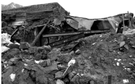
ماخذ: دکتر محمد جواد ثقفی تصویر شماره (۱)

عامل دیگر، افزایش وزن ناشی از اجرای لایه‌های متعدد کاهگل بر روی سقف‌ها می‌باشد که در نهایت موجب افزایش نیروی زلزله و فرو ریختن سقف‌ها شده است (ثقفی، ۱۳۸۵، ۶۷-۷۴). نکته قابل توجه اینست که در منطقه زرد، علاوه بر سقف‌های خشتی ضربی، در سقف‌های متشکل از تیر فلزی و طاق ضربی و حتی سقف‌های سبک هم از کاهگل برای پوشش استفاده شده است. در مواردی، به جای کاهگل از یک لایه ضخیم آسفالت استفاده شده است که بار مرده نسبتاً زیادی بر سقف تحمیل می‌کند (تصویر شماره ۳). نکته قابل توجه آن است که مردم حاضر به صرف مخارج نسبتاً بالا برای مقاوم ساختن سرپناه خود هستند ولی در بسیاری موارد دانش و تکنولوژی صحیح آن را در اختیار ندارند. همچنان که در مناطق زلزله زده پیشین نیز