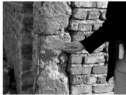
تصویر شماره (۷)

مشاهده گردیده است، در این منطقه نیز به سقف‌های سبک، آسیب جدی وارد نیامده است (تصویر شماره ۴). حتی با وجود تخریب قسمتهایی از دیوار، سقف پابرجا مانده است. این موضوع ارزیابی مثبت رفتار سقف‌های سبک و گرایش به این سیستم برای اجرای سقف‌ها را تایید می‌کند. این بدان معنی است که با تکیه بر همان تکنولوژی اجرا شده در این مناطق، می‌توان سیستم‌های سازه‌ای مناسبی اجرا کرد.