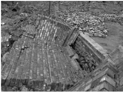
تصویر شماره (۶)