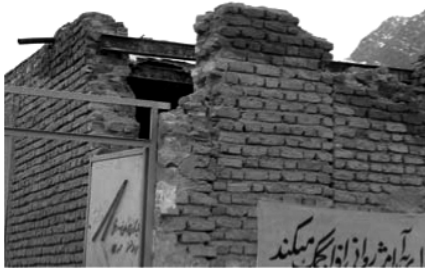
تصویر شماره (۵)