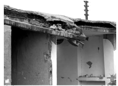
ماخذ: دکتر محمدجواد تقفی تصویر شماره (۳)