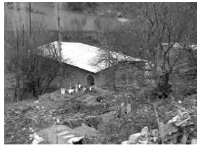
تصویر شماره (۴)