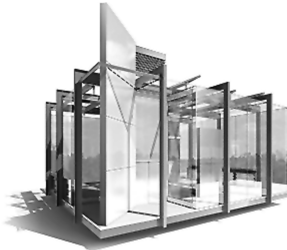
تصویر ۳- نمایی از نانو خانه