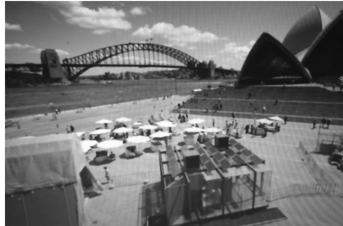
تصویر ۲- نانو خانه در استرالیا در سایت سالن اوپرای سیدنی