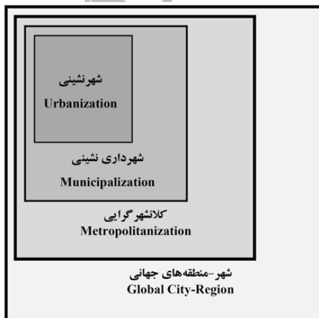
تصویر ۱- تحول ابعاد فضایی و مدیریتی کلانشهرها.

شهرداری گرای اگرچه ظرفیت حکومت های محلی را در برخورد با شرایط جدید شهرنشینی افزایش داد اما برای غلبه بر مسائل عمده آن کافی به نظر نمی رسید. حکومت های محلی و سازمان های مدیریت شهر سرانجام از آهنگ رشد شهر عقب ماندند و درحقیقت در مقیاس وسیع آن فرو رفتند. به موازات سرریز رشد شهر در ورای مرزهای حکومت محلی، مقیاس شهر از حدود شهرداری فراتر رفت (ایرانیان، ۱۳۸۵، ۸-۶).