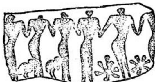
تصویر ۱- تصویر قطعه سفالی از هزاره چهارم پیش از میلاد مسیح.

مفرغ ها و سفالینه های بدست آمده از آن دوران بخش مهمی از هویت فرهنگی این قوم را در زمینه هنری بالاخص موسیقی بیان می کند (تصویر ۱).