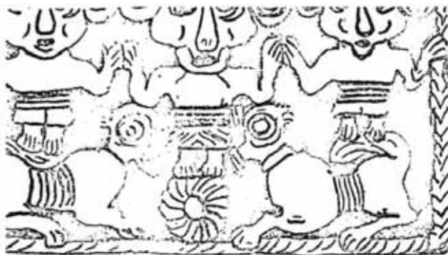
تصویر ۴- سرپرچم برنزی که در لرستان به دست آمده است. ماخذ: (امان الهی بهاروند، ۱۳۷۰)

در این سرپرچم برنزی مشبک پیکره سه رب النوع شاخدار نشان داده شده که رب النوع وسط از نظر مقام نسبت به دوتای دیگر در درجه والاتری قرار دارد و پا بر روی کره خورشید گذاشته است. دوتای دیگر نیز پا بر پشت دو شیر غران نهاده‌اند و دست در دست هم مشغول رقص می‌باشند. صاحبان این سرپرچم گویا به این طریق خواسته‌اند چرخش و حرکت خورشید را در آسمان از شرق به غرب بصورت یک رقص موزون بیان کرده و نمایش بدهند.