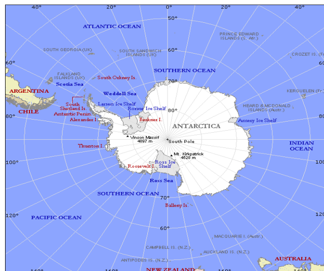
شکل ۱ موقعیت جغرافیایی قطب جنوب [۱]

جنوبگان (قطب جنوب) قاره‌ای پهناور و یخی است که مساحت کل آن با احتساب جزایر و فلاتهای یخی در حدود ۱۴ میلیون کیلومتر مربع می‌باشد [۱، ۲] (شکل ۱).