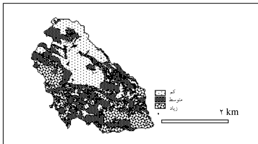
شکل ۳ نقشه درجه‌بندی بحران آب در دشت نیشابور