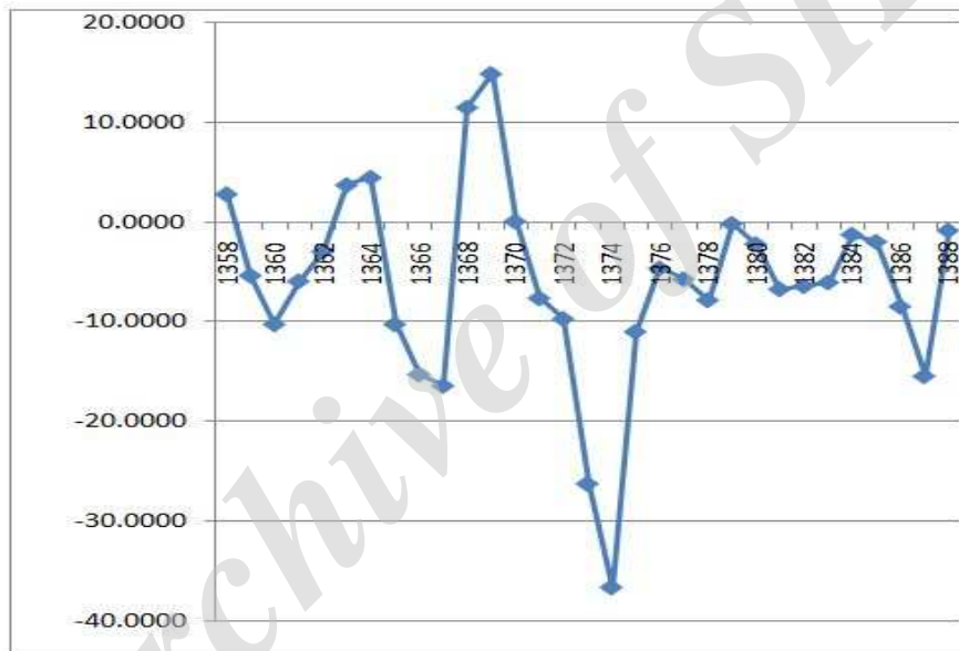
نمودار ۲. روند تغییرات شهرت مقام پولی طی سال‌های ۱۳۵۸ تا ۱۳۸۸

نمودار ۲ نوسانات شهرت مقام پولی را طی سال‌های ۱۳۵۸ تا ۱۳۸۸ نشان می‌دهد. ۱