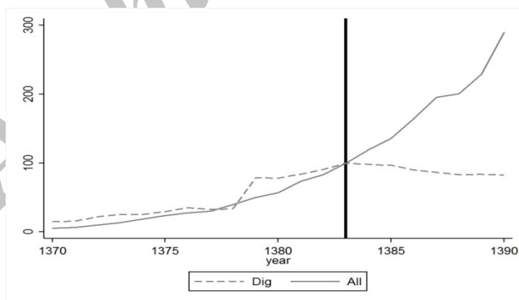
نمودار ۱. روند شاخص قیمت ارتباطات (Dig) و شاخص ضمنی تولید ناخالص داخلی (All) به قیمت ثابت ۱۳۸۳

از جمله شاخص‌هایی که در عصر جدید بسیار مهم هستند و نقش قابل توجهی در تحول فناوری و وقوع انقلاب اطلاعات داشته‌اند، قیمت‌های ارتباطات می‌باشد. بررسی شاخص‌های کل و شاخص قیمت ارتباطات اقتصاد ایران نشان می‌دهد که از سال ۱۳۸۳ میزان شاخص ارتباطات در اقتصاد ایران کم‌تر از شاخص کل قیمت و از سال مذکور به بعد همواره انحراف آن نیز از شاخص کل قیمت بیشتر شده است. این موضوع در نمودار (۱) نشان داده شده است.