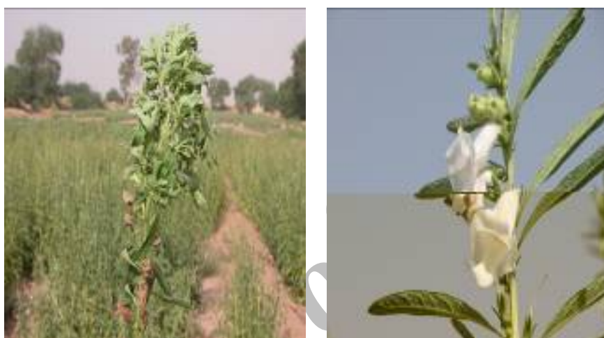
شکل ۱- گل سبز، علامت اصلی بیماری فیلودی (سمت چپ) و بوته سالم (سمت راست) Fig. 1- Green flowering, the important symptom of phyllody (Left), Health plant (Right)

است (Deeley et al. , 1979). تشخیص با این محلول رنگی اختصاصی نیست و فیتوپلاسمها را تفکیک نمی کند.