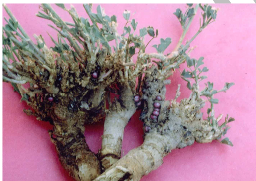
شکل ۱- استقرار کیست‌های شپشک روی طوقه گیاه یونجه

ساقه‌ها متمرکز بودند و به نظر می‌رسد که در محل‌های زخم وارده توسط سرخرطومی ریشه یونجه Sitona sp. که نسبتاً فرو رفته و عمیق هستند استقرار یافته و از شیرۀ گیاهی طوقه و ریشه یونجه تغذیه کردند. آلودگی در برخی بوته‌های نمونه برداری شده بسیار شدید بود به طوریکه حتی در اوایل تیر ماه تعداد ۱۸۱ عدد کیست آفت از روی یک بوته جداسازی شد.