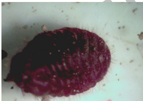
شکل ۵- حشره ماده شپشک ریشه یونجه درشت نمایی ۱۰ برابر

Margarodidae بالدار بوده و بال های جلویی کاملاً مشخص و رگبال زیر کناری آن‌ها کاملاً ضخیم و پهن و به رنگ قرمز تیره و با رگبال کناری تشکیل یک سلول نسبتاً مشخص و رنگی می‌دهند. بال‌های عقبی حشره رشد نکرده و تشکیل هالتر داده‌اند. حشرات نر پس از ظهور و بیرون آمدن از سطح خاک به صورت جهشی روی سطح خاک به تحرک می‌پردازند، به طوری که با اندکی دقت می‌توان جهش‌های کوتاه و ناگهانی آن‌ها را به وضوح روی سطح خاک مشاهده کرد.