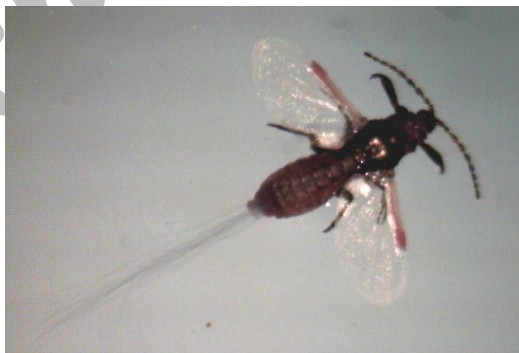
شکل ۶- حشره نر بالدار شپشک ریشه یونجه درشت نمایی ۱۰ برابر