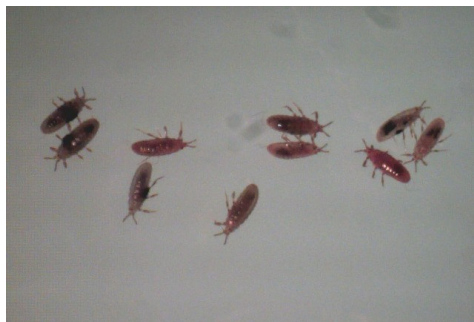
شکل ۳- پوره‌های سن یک شپشک ریشه یونجه درشت نمایی ۱۰ برابر