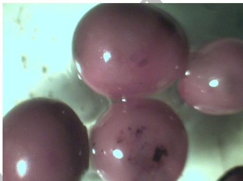
شکل ۴- کیست‌های شپشک ریشه یونجه درشت نمایی ۱۰ برابر