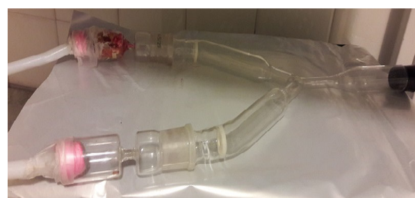
شکل ۱- بویایی سنج Y شکل مورد استفاده در آزمایش‌ها Fig. 1. Y-tube olfactometer used in the experiments

شرایط آزمایش و مشخصات بویایی سنج: برای انجام این آزمایش‌ها از یک بویایی سنج Y شکل استفاده شد که جنس آن از شیشه پیرکس به قطر داخلی ۲۸ میلی‌متر بود. بازوی اصلی ۱۶ سانتی‌متر و هریک از بازوهای فرعی ۲۱ سانتی‌متر طول داشتند. بازوهای فرعی به منبع رایحه متصل شدند. جریان هوا معادل ۱۵۰ میلی‌لیتر در دقیقه توسط پمپ باد، ایجاد شد (Dweck et al. , 2010) و پس از تصفیه توسط ذغال فعال، توسط آب اسمز مرطوب گردید و در هر دو بازوی بویایی سنج جریان یافت. پس از هر پنج تست، بازوهای بویایی سنج جابه‌جا می‌شد تا عدم تقارن سبب خطای احتمالی نشود. پس از ۱۵ آزمایش، محفظه‌های نگهداری رایحه‌ها جابه‌جا می‌شدند. تمامی آزمایش‌ها بین ساعت ۹ صبح تا ۵ بعد از ظهر انجام شدند. ساعت انجام هر تکرار، به صورت چرخشی بین تیمارها تغییر می‌کرد. زنبورهایی که پس از ورود به بویایی سنج، حداقل پنج دقیقه در بازوی اصلی می‌ماندند و هیچکدام از بازوهای فرعی را انتخاب نمی‌کردند، از آزمایش حذف می‌شدند. دمای اتاق بویایی سنجی 25 \pm 1 درجه سلسیوس و رطوبت نسبی بین ۵۰ تا ۷۰ درصد تنظیم شد.