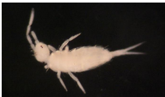
شکل ۷- نمای پشتی گونه Sinella curviseta Brook, 1882 (اصلی، درشت نمایی ۱۰x)

پراکنش در جهان: گونه‌ای جهان‌گستر است و از بسیاری از کشورها از جمله کشور چین، ژاپن، ایالات متحده آمریکا و اروپا گزارش شده است (Xu et al. , 2009) (شکل ۷).