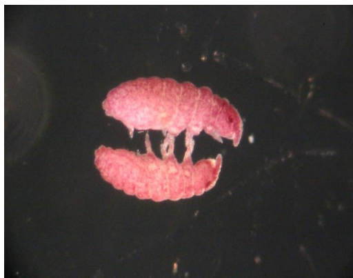
شکل ۱۹- نمای جانبی جنس Brachystomella parvula Schaffer, 1896 (عکس اصلی، بزرگنمایی ۱۰X).

پراکنش در جهان: گونه‌ی از سرتاسر جهان از جمله کشور روسیه گزارش شده است (Fjellberg, 1998; Pahar et al. , 2014) (شکل ۱۹).