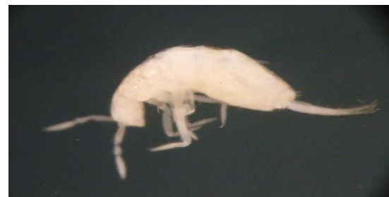
شکل ۱۵- نمای پشتی گونه Cyphoderus albinus Nicolet, 1842 (عکس اصلی، بزرگنمایی ۱۰X).

پراکنش در ایران: در ایران از استان‌های گیلان، تهران (Yoosefi Lafooraki and Shayanmehr, 2014a)، اصفهان (Yoosefi Lafooraki and Shayanmehr, 2013)، مازندران (Shayanmehr, 2014a; Darvish-Motevalli, 2016)، کرمانشاه (Abdolalizadeh et al. , 2016) و کرمان (Kahrarian et al. , 2016) گزارش شده است (شکل ۱۵). پراکنش در جهان: این گونه از اروپا و آمریکا گزارش شده است (Dekoninck et al. , 2007).