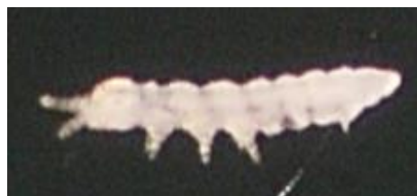
شکل ۱۸- نمای جانبی جنس Acheroxenylla Ellis, 1976 (عکس اصلی، بزرگنمایی ۱۰X).

جنس Acheroxenylla Ellis, 1976 برای اولین بار از ایران گزارش می‌شود. از این جنس تنها سه گونه در دنیا گزارش شده است (Bellinger et al. , 1996-2019). سه نمونه از شهر کرمان از خاک جنگل قائم در تاریخ ۹۵/۵/۲۶ جمع‌آوری شد (شکل ۱۸) که گونه دقیق آن نیاز به بررسی بیشتر دارد.