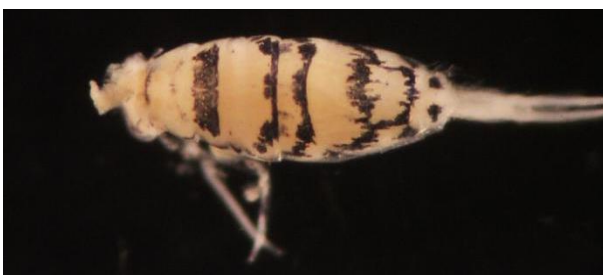
شکل ۱۰- نمای پشتی گونه Entomobrya indica (Baijal, 1955)

پراکنش در ایران: این گونه برای اولین بار از ایران گزارش می‌شود. پراکنش در جهان: گونه‌ی فوق از ایالات تبت و جارخند در هندوستان (Baquero et al., 2013; Yadav, 2017) گزارش شده است.