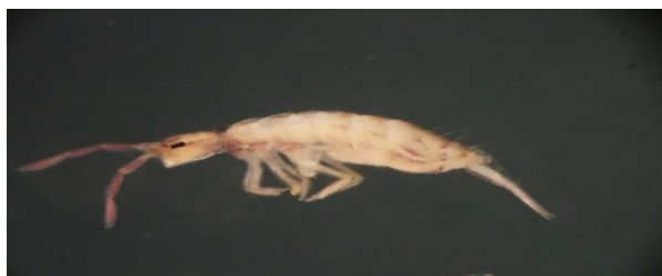
شکل ۱۳- نمای پشتی گونه Drepanura sp.

نمونه‌های مطالعه شده: علاوه بر گونه D. kirgisica ، ۱۰ نمونه از این جنس از شهرستان کرمان، شهر شهداد از خاک باغ خرما در تاریخ ۹۶/۳/۵ جمع‌آوری شد. ولی گونه مورد نظر مشخصات ریخت‌شناسی متفاوتی نسبت به گونه‌های شناسایی شده نشان داده است که نیاز به بررسی بیشتر دارد (شکل ۱۳).