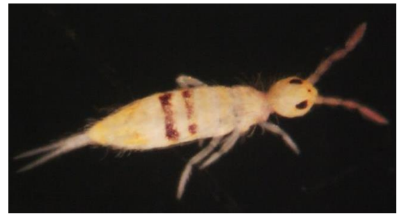
شکل ۱۴- نمای پشتی گونه Seira sp. (عکس اصلی، بزرگنمایی ۱۰X). Fig. 14. Dorsal habitus of Seira sp. (Original, magnification 10x)..

نمونه‌های مطالعه شده: از این گونه ۱۰ نمونه از شهرستان کرمان، شهر ماهان، روستای سکنج از خاک باغ گیلاس در تاریخ ۹۵/۴/۱۰ جمع‌آوری شد.