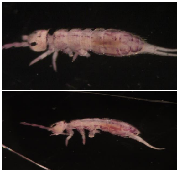
شکل ۶- نمای جانبی و پشتی نمونه جنس Isotomurus (اصلی، درشت نمایی ۱۰x).