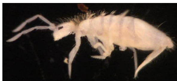
شکل ۱۱- نمای پشتی گونه Entomobrya sp.

نمونه‌های مطالعه شده: علاوه بر گونه E. indica ، ۱۰ نمونه از این جنس از شهرستان کرمان، روستای کوهپایه از خاک کف رودخانه در تاریخ ۹۵/۴/۲۰ جمع‌آوری شده‌اند ولی گونه مورد نظر مشخصات ریخت‌شناسی متفاوتی نسبت به گونه‌های شناسایی شده نشان داده است که نیاز به بررسی بیشتر دارد (شکل ۱۱).