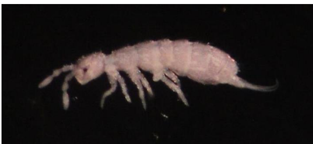
شکل ۳- نمای جانبی گونه Parisotoma notabilis (Schäffer, 1896)

پراکنش در ایران: در ایران از استان‌های مرکزی، آذربایجان شرقی و غربی، زنجان، کرمانشاه، گیلان، مازندران و تهران (Shayanmehr et al., 2013) گلستان (Hosseini et al., 2016) خوزستان (Ramezani and Mossadegh, 2017) و کرمان (Abdolizadeh et al., 2017) گزارش شده است. پراکنش در جهان: گونه‌ای جهان‌گستر است (Potapow, 2001) (شکل ۳).