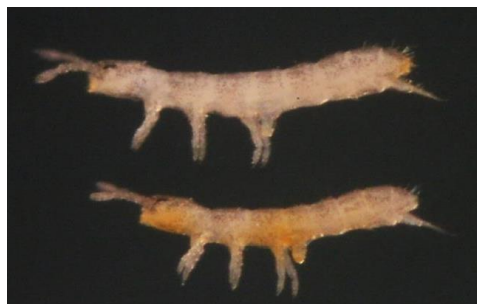
شکل ۴- نمای جانبی دو نمونه از جنس Hemisotoma (اصلی، درشت نمایی ۱۰x).