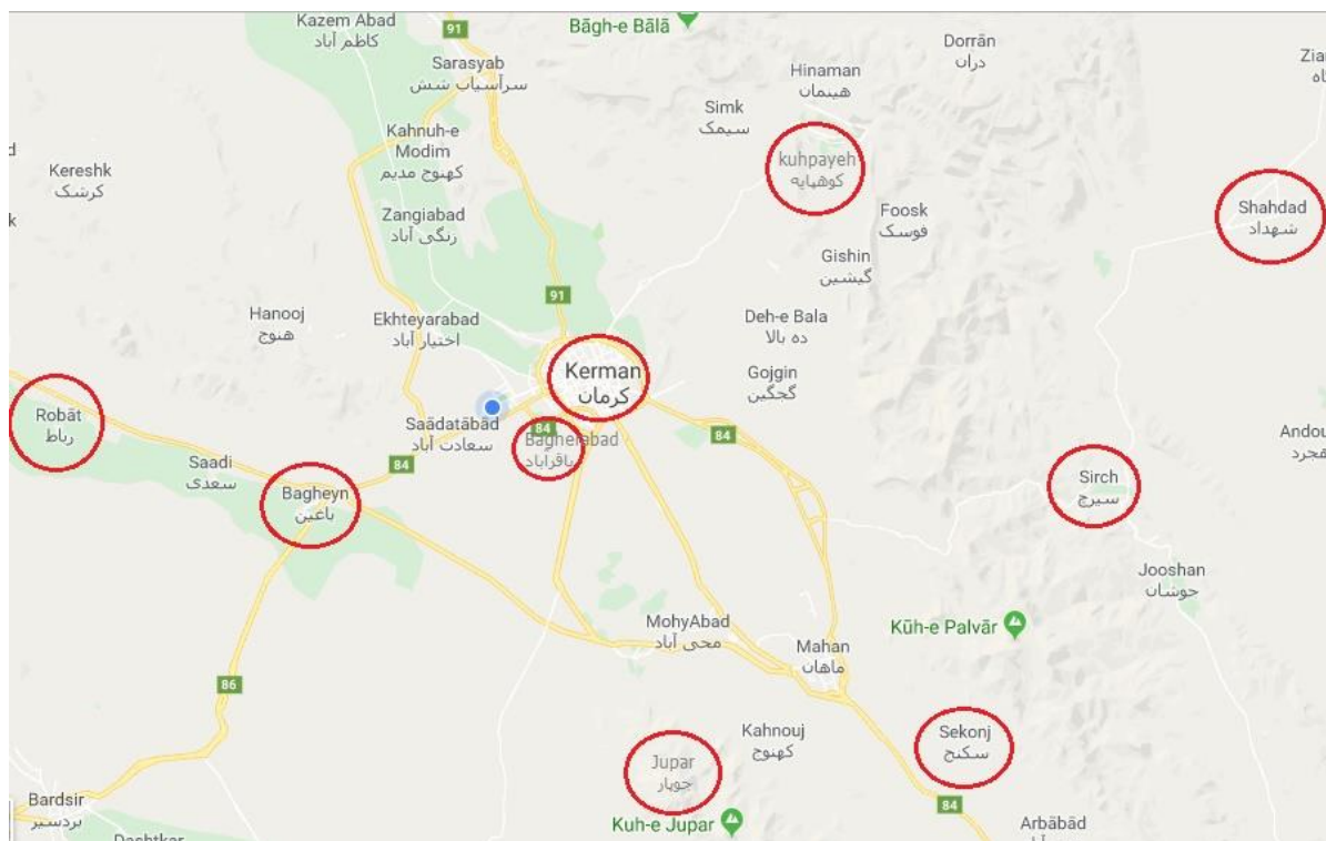
شکل ۱- مناطق مورد بررسی برای جمع‌آوری پادمان در شهر کرمان و حومه ( https://www.google.com/earth ).

شناسایی (Yoosefi Lafooraki and Shayanmehr, 2013). نمونه‌ها با استفاده از کلیدهای معتبر از جمله فجلبرگ (۱۹۹۸) و (۲۰۰۷) و کلیدهای موجود در سایت www.Collembola.org انجام شد و شناسایی گونه‌ها به تایید نویسنده‌های سوم و چهارم رسید. اسلایدهای میکروسکوپی و نمونه‌های نگهداری