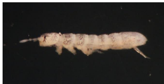
شکل ۵- نمای جانبی گونه Folsomia diplophthalma (Axelson, 1902) (اصلی، درشت نمایی ۱۰x).

پراکنش در ایران: این گونه در ایران برای اولین بار از استان کرمان گزارش شده است (Abdolalizadeh et al. , 2018). پراکنش در جهان: این گونه از مناطق مختلف پالئارکتیک، نئارکتیک، اوریتال و نیوزیلند گزارش شده است (Folsom et al. , 1919; Womersley, 1936; Edos and Deharveng., 1994; Thibaud, 2017) (شکل ۵).