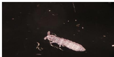
شکل ۱۷- نمای پستی گونه Xenylla sp. (عکس اصلی، بزرگنمایی ۱۰X).

از جنس Xenylla Tullberg, 1869 در ایران چهارگونه از آذربایجان غربی و شرقی، کهگیلویه و بویراحمد، گیلان و مازندران گزارش شده است (Shayanmehr et al. , 2013; Mohammadi, 2018) که نمونه‌های جمع‌آوری شده با این گونه مطابقت نداشتند و باید مجدداً بررسی شوند (شکل ۱۷).