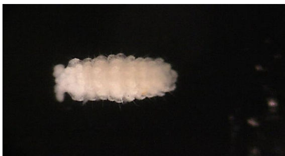
شکل ۲۰- نمای پستی گونه‌ای از زیرخانواده Neanurinae (عکس اصلی، بزرگنمایی ۱۰X).

نمونه‌های مطالعه شده: از این گونه ۱۰ نمونه از شهرستان کرمان، روستای سیرچ از خاک باغ انجیر در تاریخ ۹۶/۴/۱۷ جمع‌آوری شد. از این زیرخانواده گونه‌های جدیدی برای فون ایران و دنیا گزارش شده است که نمونه مورد مطالعه برای تعیین جنس و گونه نیاز به بررسی بیشتر دارد (شکل ۲۰).