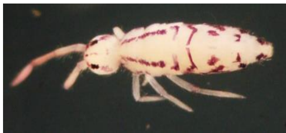
شکل ۱۲- نمای پشتی گونه Drepanura kirgisica Martynova, 1971