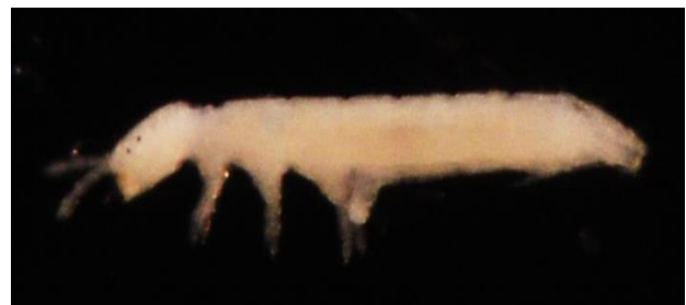
شکل ۲- نمای جانبی گونه Folsomides parvulus (Stach, 1922)

پراکنش در جهان: گونه‌ای جهان‌گستر است (Potapow, 2001) (شکل ۲).