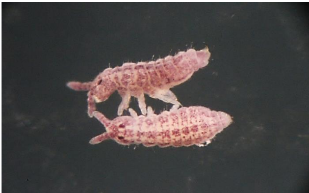
شکل ۱۶- نمای پشتی و پهلوئی از دو نمونه گونه (Gisin, 1949) Ceratophysella denticulata (عکس اصلی، بزرگنمایی ۱۰X).

پراکنش در جهان: گونه‌ی ذکر شده در مناطق پالئارکتیک و نئارکتیک دارای بیشترین فراوانی می باشد (Saltzwedel et al. , 2016) (شکل ۱۶).