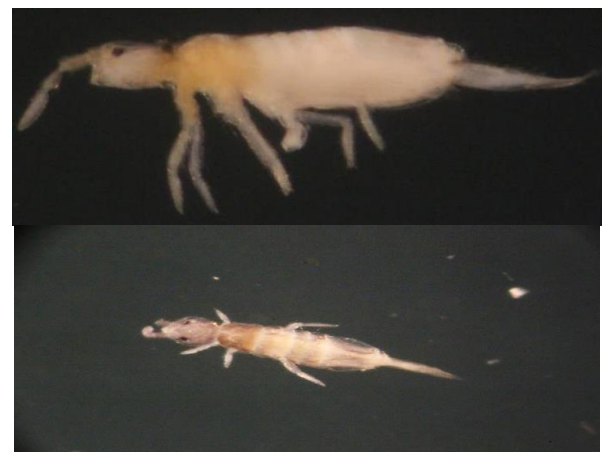
شکل ۸- نمای جانبی و پشتی گونه Pseudosinella octopunctata

پراکنش در ایران: این گونه از استان‌های مرکزی، گیلان، زنجان، آذربایجان شرقی و غربی، مازندران (Shayanmehr et al., 2013; Yoosefi Lafooraki and Shayanmehr, 2013, 2014; Balvasi et al., 2015a; Darvish-Motevalli, et al., 2015; Mehrafrooz et al., 2016; Alijani-Ardeshir et al., 2016; Ghasemi Cherati, 2017) تهران (Qazi and Shayanmehr, 2014, a, b)، اصفهان (Yoosefi Hosseini et al., ) گلستان (Laflooraki and Shayanmehr, 2013) (Kahrarian et al., 2014)، گیلان (Daghighi et al., 2016)، کرمانشاه (Abdolalizadeh et al., 2017) گزارش شده است. پراکنش در جهان: گونه‌ای جهان‌گستر است و از بسیاری از کشورها از جمله چین گزارش شده است (Wang et al, 2004) (شکل ۸).