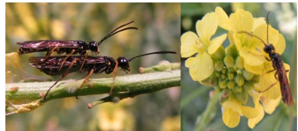
شکل ۱- زنبور ساقه‌خوار غلات بر روی گل علف‌های هرز حاشیه مزرعه گندم (فریم نیمه اردیبهشت ۱۳۹۴).

قرار گرفته است (Chernov 1976, Holmes & Peterson 1964, Weiss & Morrill, Mcneal & Berg 1979, Morrill et al. 1992, Sherman et al. 2010, Beres et al. 2009). تناوب زراعی و استفاده از ارقام مقاوم به ترتیب موجب کاهش ۱۴ و ۱۰ درصدی جمعیت لارو زنبور ساقه خوار غلات گشته و از کاهش عملکرد جلوگیری می‌کند (Banita et al., 1992). همچنین مقدار سفتی و پر بودن داخل ساقه، میزان مقاومت گندم به زنبور ساقه‌خوار را تعیین می‌کند (Morrill et al., 1992, Holmes & Peterson 1964, Mcneal & Berg 1979). این تحقیق با هدف ارزیابی چند رقم رایج و لاین‌های امیدبخش گندم و یک رقم جو (صحرا) نسبت به خسارت زنبور ساقه خوار غلات اجرا شد.