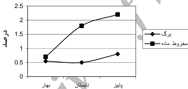
شکل شماره ۲- مقایسه درصد نسبی اسانس در نمونه‌های برگ و مخروط‌های ماده درخت ارس در فصول مختلف

hexyl 2-methyl و methyl carvacrol, cumin alcohol butyrate فقط در مقادیر بسیار ناچیز در مخروط‌های ارس مشاهده می‌شوند.