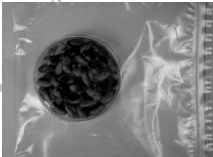
شکل شماره ۲- طرح بسته‌بندی جهت بررسی اثرات ضدقارچی عصاره آویشن شیرازی در مغز پسته سترون پوشش دیده با پوشش‌های حاوی عصاره در دمای ۲۵ درجه سانتی‌گراد و رطوبت نسبی ۷۵ درصد

ترکیبات عمده شیمیایی تشکیل‌دهنده عصاره روغنی آویشن شیرازی در جدول شماره ۱ ذکر شده است. در آزمون بررسی تعیین فعالیت مهار عصاره الکلی آویشن شیرازی میزان مهار رشد در غلظت‌های ۱، ۲، ۳، ۴ و ۵ درصد عصاره در دیسک حاصل از فیلم پروتئین آب پنیر به ترتیب ۱۱، ۱۳، ۱۸، ۲۳ و ۲۷ میلی‌متر بود. این میزان مهار رشد در گروه کنترل که فیلم‌های بدون عصاره را شامل می‌شد، صفر میلی‌متر بود. حداقل غلظت مهار برای عصاره آویشن شیرازی بر روی آسپرژیلوس فلاووس ۹۰ ppm از غلظت ۳۰ درصد عصاره تعیین شد. نتایج حاصل از این مرحله نشان داد که عصاره‌های