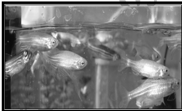
شکل شماره ۱- ماهی زبرا بالغ پرورش یافته در مرکز تحقیقات زیست فنآوری دانشگاه علوم پزشکی تهران

جدول شماره ۱- طبقه‌بندی علمی ماهی Danio rerio (۱).