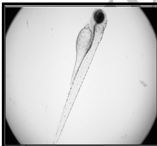
شکل شماره ۳- لارو ماهی زبرا پرورش یافته در مرکز تحقیقات زیست فناوری دانشگاه علوم پزشکی تهران

خارج از رحم صورت می‌گیرد) و به این ترتیب امکان ردگیری اثرات مختلف ترکیبات مورد آزمایش امکان‌پذیر خواهد شد. نکته کلیدی دیگر در بررسی مولکول‌های فعال با استفاده از لارو و جنین این ماهی، امکان افزودن ترکیبات به صورت غیراستریل به محیط رشد آن‌ها است که سرعت انجام روندهای غربالگری را افزایش می‌دهد [۴].