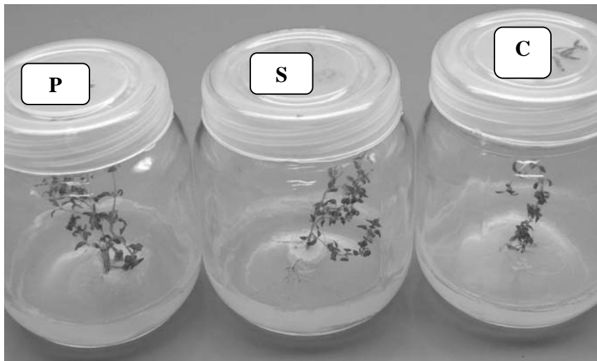
شکل شماره ۲- تأثیر قارچ‌های P. indica و S. vermifera روی رشد گیاه آویشن ( T. vulgaris ) در شرایط درون شیشه‌ای. (P = Piriformospora indica , S = Sebacina vermifera and C = control)