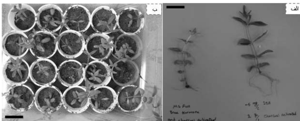
شکل شماره ۲- ریشه‌زایی و سازگاری گیاه به لیمو. ۲- الف- مقایسه ریشه‌زایی در تیمار هورمونی حاوی ۰/۵ میلی‌گرم در لیتر IBA و ۲ میلی‌گرم در لیتر ذغال فعال با تیمار محیط کشت پایه MS بدون ذغال فعال، چهار هفته پس از کشت. ۲- ب- گیاهچه‌های سازگار شده به لیمو در شرایط برون شیشه‌ای (مقیاس = ۲ سانتی‌متر).

جدول شماره ۲- اثرات غلظت‌های مختلف IBA و NAA به تنهایی و یا در ترکیب با ذغال فعال بر درصد ریشه‌زایی و طول ریشه‌ها چهار هفته بعد از کشت.