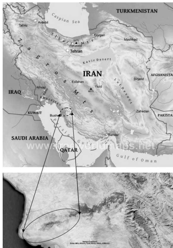
شکل شماره ۱- وضعیت قرارگیری حوزه آبریز شمال شرقی خلیج فارس در حاشیه خلیج فارس و ایران

جدول شماره ۲ لیست گونه‌های گیاهی به همراه خواص دارویی، نام متداول [۲۰]، نام محلی و دیگر مشخصات گونه‌های گیاهی را نشان می‌دهد. پرجمعیت‌ترین خانواده گیاهی خانواده کاسنی یا گل‌مینا (Asteraceae) با ۷ گونه می‌باشد و پس از آن به ترتیب خانواده‌های شب‌بو (Brassicaceae) با ۶ گونه، خانواده چتریان (Apiaceae) با ۵ گونه و خانواده‌های نعناع (Lamiaceae)، بارهنگ (Plantaginaceae) و چمن (Poaceae) هر کدام با ۴ گونه در رتبه‌های بعدی قرار می‌گیرند. شکل شماره ۲ پرجمعیت‌ترین خانواده‌های گیاهی حوزه مورد مطالعه را نشان می‌دهد.