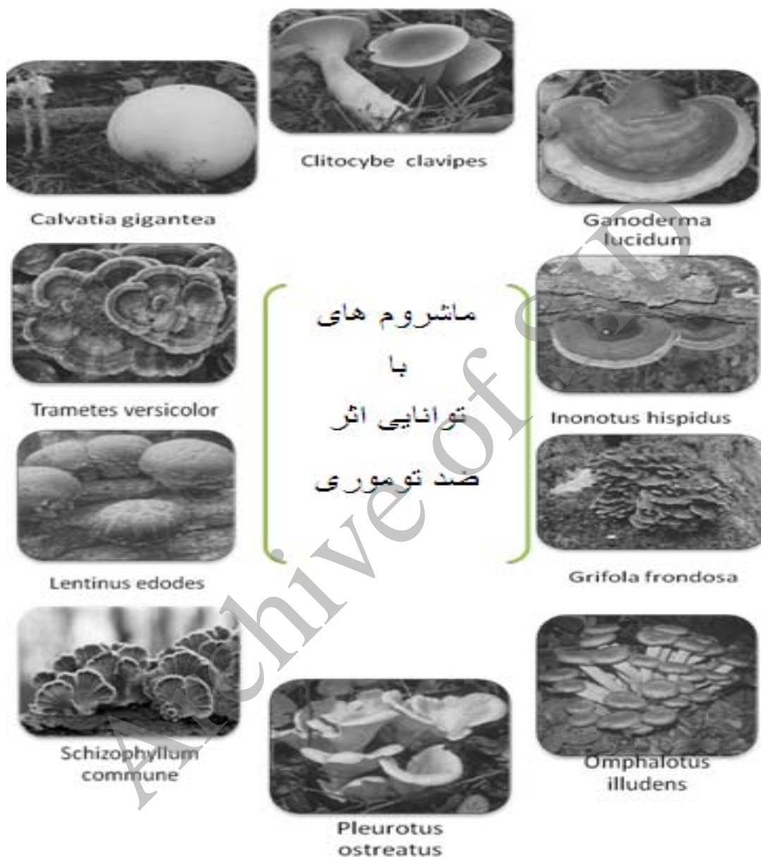
شکل شماره ۱- نام و تصویر برخی ماشروم‌های با توانایی تولید ترکیبات با اثر ضدتوموری

در شکل شماره ۱ به برخی از انواع قارچ‌ها که منبع امیدوارکننده‌ای برای درمان طبیعی و موفق بیماری‌های سرطان محسوب می‌شوند، اشاره شده است.