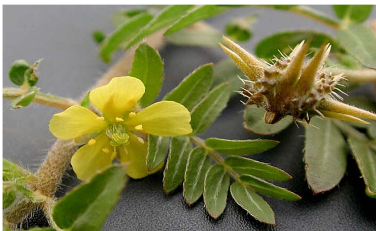
تصویر شماره ۲- تصویر گیاه خارخاسک و بخش‌های مختلف آن