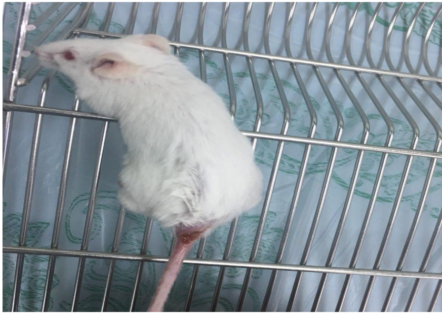
شکل ۱. زخم ایجاد شده در موش، چهار هفته پس از تلقیح انگل لیثمانیا ماژور در قاعده دم موش