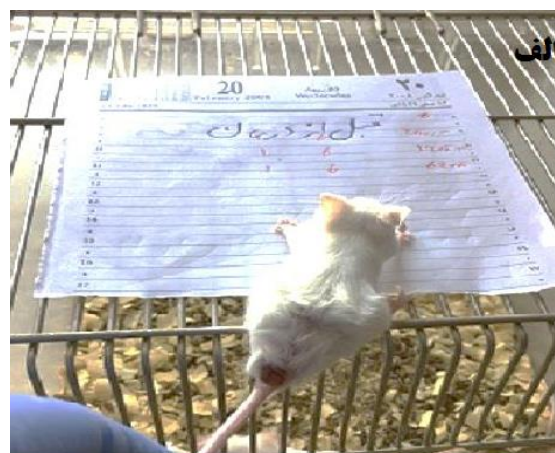
شکل ۳. موش آلوده شده با لیشمانیا ماژور، گروه تیمار شده با داروی گلوکانتیم (الف) قبل از درمان (ب) پس از درمان