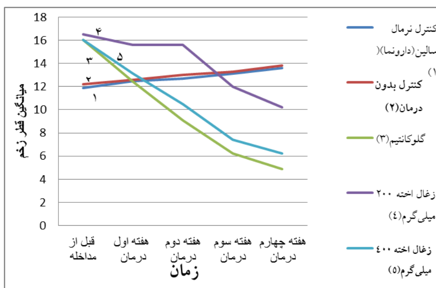
نمودار ۱. نتایج قطر زخم در گروه‌های مورد مطالعه در زمان‌های مورد بررسی

قبل و پس از تیمار در گروه‌های دریافت‌کننده گلوکانتیم، زغال اخته ۲۰۰ و ۴۰۰ میلی گرم برکیلوگرم به طور معنی‌داری از گروه‌های کنترل نرمال سالیین و کنترل بدون درمان بیشتر است ( P < 0/001 ). همچنین در مقایسه بار انگلی قبل و پس از درمان در تمامی گروه‌های مورد مطالعه به جز گروه کنترل بدون درمان تفاوت معنی‌داری مشاهده شد ( P < 0/05 ) به