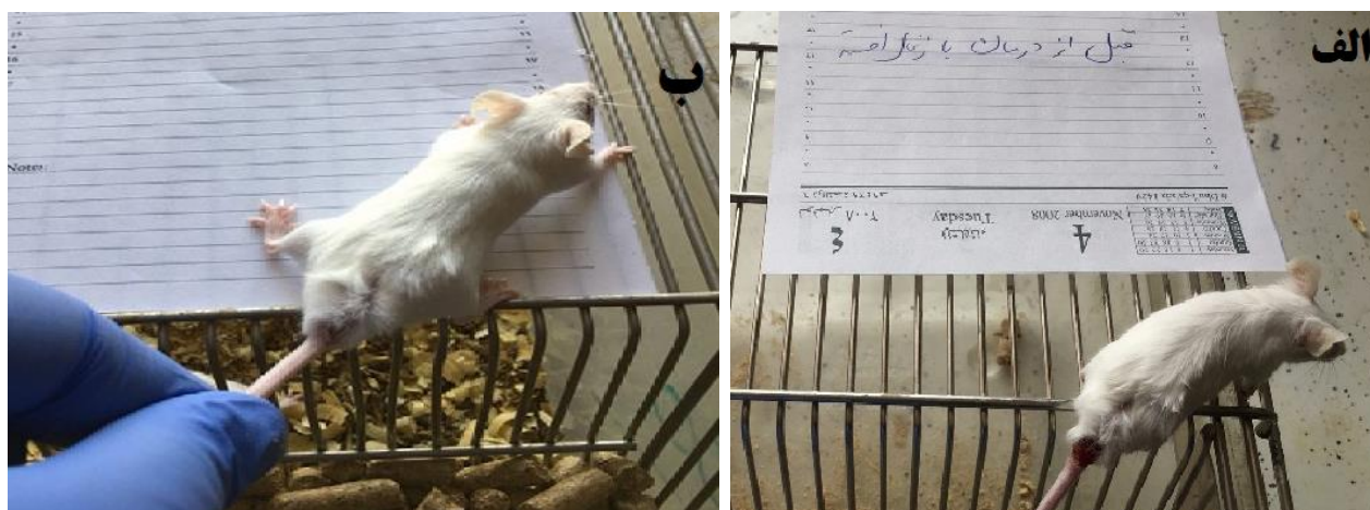
شکل ۲. موش آلوده شده با لیشمانیا ماژور، گروه تیمار شده با عصاره زغال اخته با غلظت ۴۰۰ میلی گرم بر کیلوگرم (الف) قبل از درمان (ب) پس از درمان