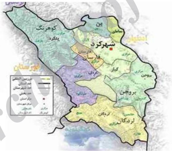
شکل ۱. محل جمع‌آوری نمونه‌های شیر جهت مشخص شدن وضعیت شیوع کوکسیلا بورتتی در شهرستان شهرکرد، ایران.

منطقه مورد مطالعه. مطالعه‌ی حاضر در شهرستان شهرکرد روی نمونه‌های شیر گاو گرفته شده از مخزن شیرگاو‌داری‌های سنتی انجام شد. این شهرستان مرکز استان چهارمحال و بختیاری و از جمله مناطق کوهستانی جنوب غربی ایران است.