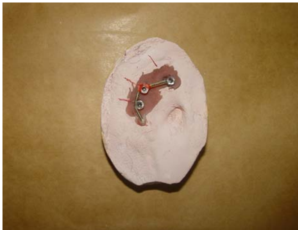
شکل ۶- کست نهایی و ساختار فلزی روی آن

۱۰- جراحی دوم و قرار دادن هیلینگ کپ بعد از ۴ ماه، جراحی دوم انجام شد و هیلینگ کپ به قطر ۴ میلی‌متر (Southern Implants، ژوهانسبورگ، آفریقای جنوبی) بر روی فیکسچرها بسته شد. جهت ترمیم بافت نرم و ادامه درمان ۴ هفته زمان داده شد (۱). ۱۱- قالب گیری نهایی (Final impression) تری اختصاصی آکریلی آماده شد. سه عدد کوپینگ قالب‌گیری از نوع پیک آپ به قطر ۴/۵ میلی‌متر (Southern Implants، ژوهانسبورگ، آفریقای جنوبی) بر روی فیکسچرها بسته شدند. محل کوپینگ‌ها روی تری سوراخ گردید. کوپینگ‌ها به وسیله آکریل (Relience, duralay، ورس، ایلینوین، آمریکا) به یکدیگر متصل شده، با ماده پلی‌اتر (3M, Impregum، سنت پائولی، آلمان) قالب‌گیری انجام گردید (۱۲) (شکل ۵).