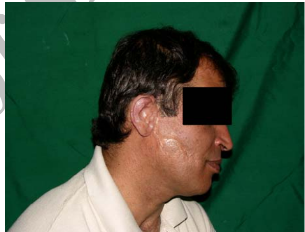
شکل ۱۰- نمای نیم رخ بیمار