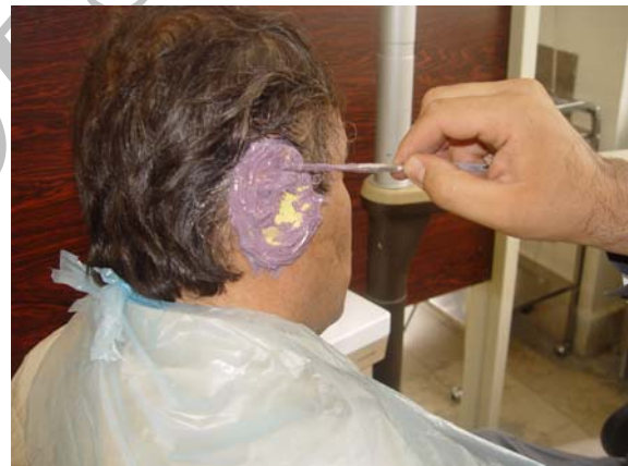
شکل ۵- قالب گیری نهایی به روش پیک آپ

۱۲- تهیه کست نهایی بعد از باز کردن پیچ کوپینگ‌های قالب‌گیری، قالب برداشته شد. آنالوگ فیکسچرها به قطر ۴/۵ میلی‌متر (Southern Implants، ژوهانسبورگ، آفریقای جنوبی) به کوپینگ‌ها بسته شد. نواحی اطراف کوپینگ‌ها، ماده بازسازی کننده لثه (Detax, Esthetic mask، اتلینگن، آلمان) گذاشته شد. اطراف فیکسچرها گچ و لمبیکس (Prevest، فلوریدا، آمریکا) و بقیه نواحی با گچ استون نوع دو (پارس دندان، تهران، ایران) ریخته شد. ۱۳- ساختار فلزی ۳ عدد اباتمنت پلاستیکی UCLA به قطر ۴/۵ میلی‌متر ۱۴- امتحان ساختار فلزی ساختار فلزی روی گوش بیمار بسته شد. هیچگونه حرکت الاکلنگی و عدم نشست نداشت (شکل ۷). ۱۵- ساخت بیس آکریلی روی ساختار فلزی هدف از ساخت این بیس عبارت بود از: ۱- قرار دادن غلاف اتچمنت طلایی (Gold clip attachment) (Southern Implants، ژوهانسبورگ، آفریقای جنوبی) در اتصال با آن. ۲- اتصال پروتز گوش سیلیکونی با استفاده از سوراخ‌های ریز متعدد روی بیس. از آکریل خودپخت (Dentaurum, Orthocryl, Germany, Springen) استفاده شد.