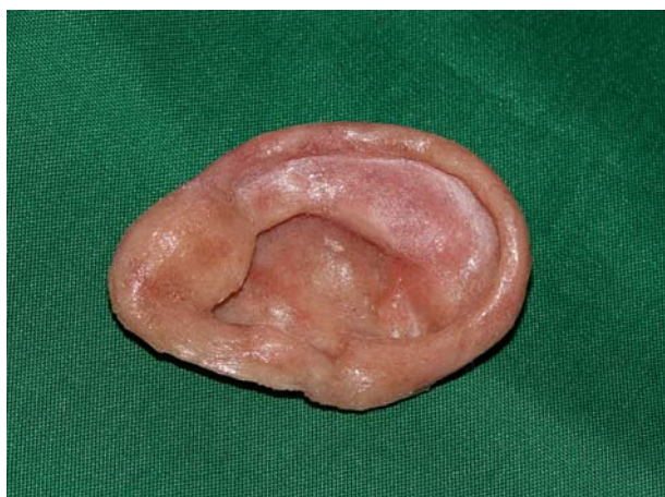
شکل ۸- پروتز گوش نهایی