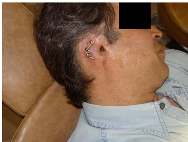
شکل ۷- امتحان ساختار فلزی روی بیمار

نحوه تمیز کردن ساختار فلزی، پروتز گوش و پوست به بیمار آموزش داده شد. همچنین به در آوردن پروتز هنگام خواب و استحمام تأکید شد.