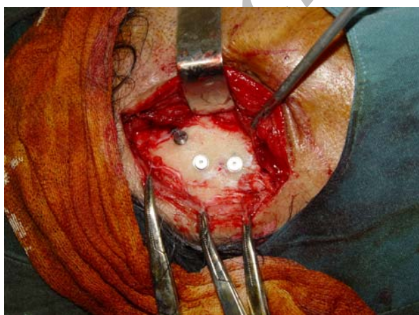
شکل ۴- جراحی مرحله اول و قرار دادن سه ایمپلنت در ماستوئید

جراحی تحت بیهوشی عمومی و شرایط بیمارستانی انجام شد. ایمپلنت‌ها در ماستوئید راست کاشته شدند (شکل ۴).