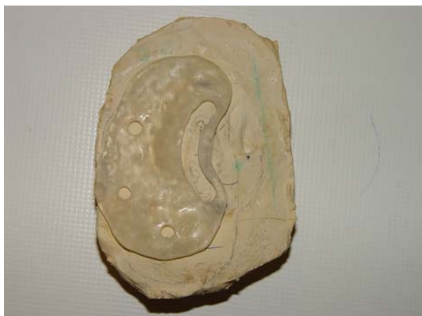
شکل ۳- تمپلیت جراحی

از ناحیه ماستوئید راست سی تی اسکن تهیه شد. ضخامت و دانسیته استخوان ماستوئید بررسی و ارزیابی شد. ایمپلنت به طول ۴ میلی‌متر قابل به کارگیری بود.