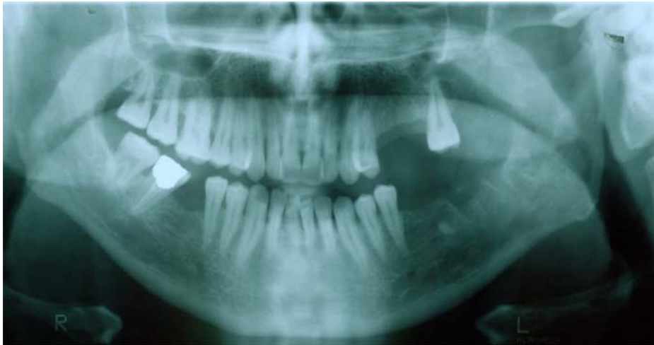
شکل ۲- نمای رادیوگرافی ضایعه. رادیولوسنسی مولتی لوکولار دیده می‌شود.