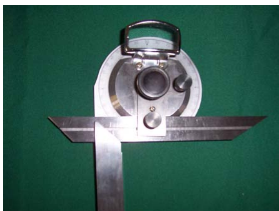
شکل ۲- زاویه‌سنجی که جهت اندازه‌گیری زوایا استفاده شد.