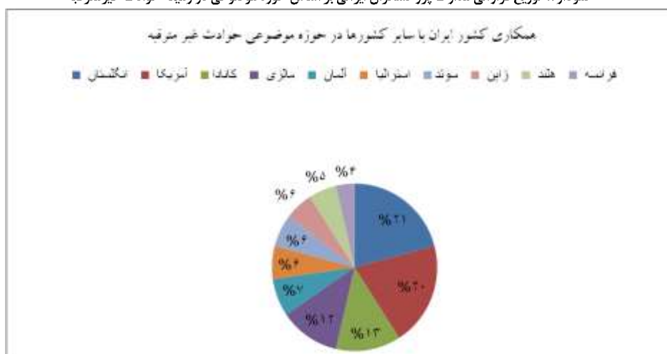
نمودار ۳. همکاری پژوهشگران ایرانی با سایر کشورها در حوزه موضوعی حوادث غیر مترقبه