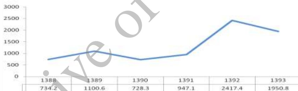
نمودار ۱. روند میزان بروز سوانح و حوادث در سالمندان استان همدان طی سال های ۹۳-۱۳۸۸