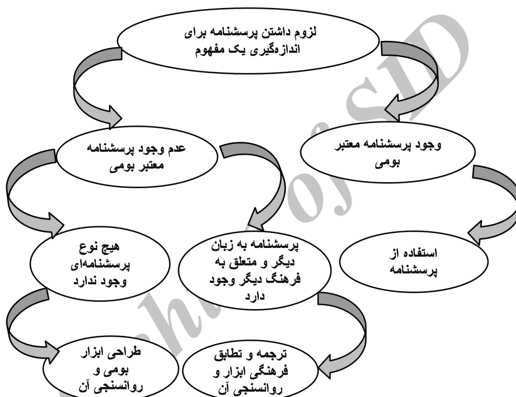
شکل ۱: فرایند دستیابی به ابزار برای پژوهش

نیست. مطالعات مختلف استفاده از ده، ۱۰۰ و بیش از ۱۰۰ نفر را برای نمره تأثیر گویه گزارش کرده‌اند [۳۶, ۳۷]. در مفاهیم بالینی بررسی تأثیر گویه به شکل دیگری هم بررسی می‌شود؛ بدین صورت که بیمار تجربه خود از هر یک از علائم بیماری که در پرسشنامه گنجانده شده را بر اساس طیف لیکرتی علامت می‌زند و