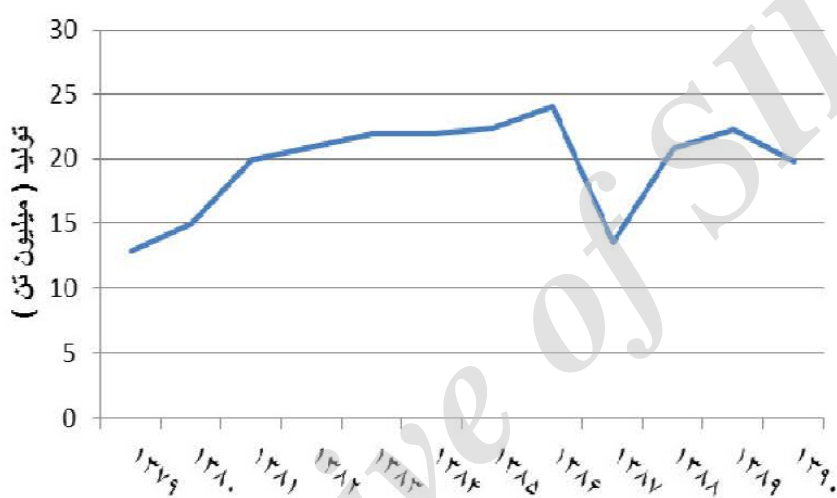
نمودار ۲. میزان تولید غلات در دوره ۹۰-۱۳۷۹

براساس نتایج تحقیق، اسدی (۱۳۸۰) یک ریال مخارج در تولید رقم های مورد مطالعه گندم، ۲۵/۸ ریال منفعت ایجاد می کند و نرخ بازده مخارج تحقیقات ۷۷/۸ درصد است. افزون بر این با توجه به یافته های مطالعه ربیعی (۱۳۸۷) تحقیق و توسعه در ایران از طریق مستقیم و اثر نوآوری، بر روی تولید و رشد اثر قابل توجهی ندارد اما به طور غیرمستقیم یعنی تقلید فناوریانه اثر کمی بر روی رشد تولید دارد.