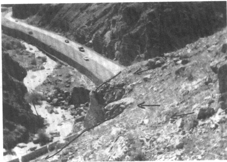
شکل ۳ توفهای دانه درشت هوازده با ترکیب آندزیتی با رنگ سبز کم رنگ در امتداد جاده سولقان

جهت شناسایی هرچه بیشتر از سنگ‌های تشکیل دهنده مواد دامنه‌ای موجود در منطقه از امتداد جاده سولقان و از روی دامنه مشرف به آن حدود ۲۵ نمونه جمع‌آوری و مورد بررسی قرار گرفتند. نمونه‌های جمع‌آوری شده در گروه‌های مختلف (سینگ، ب و رک. گوویل، ۱۳۸۲) و (Bieniawski. Z. T, 1989) دسته‌بندی شده‌اند. این دسته‌ها شامل توف، توف شیشه‌ای، توف آندزیتی، توف تراکی آندزیتی، آندزیت، ریوداسیت و دیاباز، شیل، سنگ آهک می‌باشند. اکثر مقاطع دارای رنگ سبز و سبز تیره و دانه‌ریز است و تا حدودی هوازده شده‌اند.