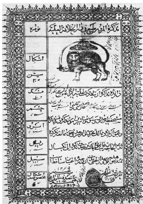
شکل ۱ تذکره ایرانی دارای نشان شیر و خورشید

خورشیدی (۱۹۲۶ میلادی) جامعه ملل، مقررات یکسانی را برای گذرنامه‌های کشورهای عضو وضع کرد. ایران نیز با پذیرش این اعلامیه، گذرنامه را به صورت کتابچه‌ای درآورد که ابعاد آن با گذرنامه‌های اروپایی یکسان بود. این مقررات در سال ۱۳۱۱ ه.ش. در ایران به صورت لایحه‌ای به مجلس داده شد و سال بعد با آیین‌نامه‌ای به تصویب رسید و تا ۴۰ سال به قوت خود باقی ماند (همان: ۲۲۱-۲۱۷).