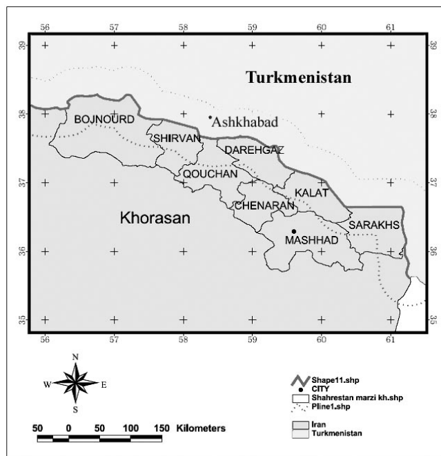
نقشه ۲ منطقه مورد مطالعه (نوار مرزی شمال خراسان)

بدین ترتیب شایسته است مسئولین دو کشور با تجدید نظر اساسی و حل مشکلات اندکی که در کنار اجرای این طرح ایجاد شده است، زمینه بهره‌مندی مطلوب و مفید مرزنیسان را از تسهیلات آن بیش از پیش فراهم نمایند.