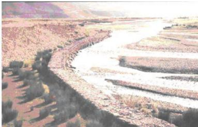
شکل 2- نمایی از اپی و دایک احداث شده در منطقه دهنه سنگ (حوضه آبخیز سد لار)

این مقاله نتیجه طرح تحقیقاتی اجرا شده با عنوان: ارزیابی نتایج عملیات آبخیزداری اجرا شده در حوضه آبخیز سد لار است، که در سال 1377 شروع شد و در سال 1380 توسط مرکز تحقیقات کشاورزی و منابع طبیعی استان تهران با همکاری مرکز تحقیقات حفاظت خاک و آبخیزداری به انجام رسید. شایسته است در همین جا از کلیه کارشناسانی که در انجام این طرح همکاری نموده‌اند، تقدیر و تشکر شود.