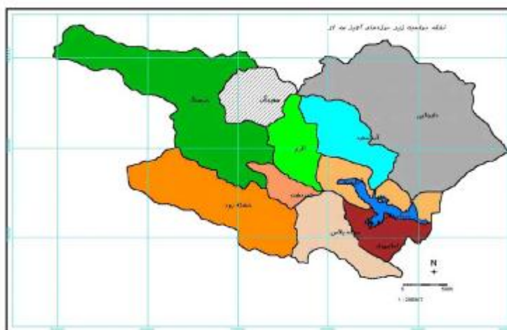
شکل ۱: موقعیت زیر حوضه های حوضه آبخیز سد لار

درجه اهمیت و اولویت کارهای انجام شده در قالب اپی‌ودایک زیرحوضه‌های خشکه رود - لار و آب سفید جهت بررسی نحوه احداث و ارزیابی عملکرد فنی و اقتصادی اپی‌های احداثی انتخاب گردید. در سال 1359 کار احداث سد لار به اتمام رسید و با استفاده از تونل 26 کیلومتری لار- لتیان گام بزرگی در جهت تامین آب شرب جمعیت چند میلیونی تهران برداشته شد. حوضه آبخیز لار بین عرض جغرافیایی 35^{\circ} 48' الی 36^{\circ} 40' و طول جغرافیایی 51^{\circ} 32' الی 52^{\circ} 41' واقع شده است.