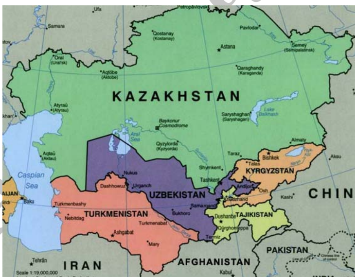
نقشه ۲: کشورهای منطقه آسیای مرکزی (Politicspeaksvalleys, 2009, 2)

همچنین این اولین بار است که نیروهای نظامی ایالات متحده در کمتر از ۲۰۰ مایلی مرزهای غربی کشور چین مستقر شده‌اند. وضعیت کنونی این احساس را به پکن القا می‌کند که تاکتیک محاصره با یک سد، توسط ایالات متحده علیه منافع این کشور در حال انجام است (Ferrari, 2003, 10). بر این اساس، چین مصمم است تا در برخی عرصه‌ها هماهنگی با جبهه‌ی مسکو در مقابل غرب ظاهر شود و در همین راستا با روس‌ها در چارچوب سازمان همکاری شانگهای ۲۲ پیش‌می‌رود و مایل است تا همکاری استراتژیک و نزدیکی را با اعضای این سازمان در برابر افزایش حضور ناتو و ایالات متحده در حیطه‌ی نفوذ خود در اوراسیای مرکزی پایه‌ریزی کند.