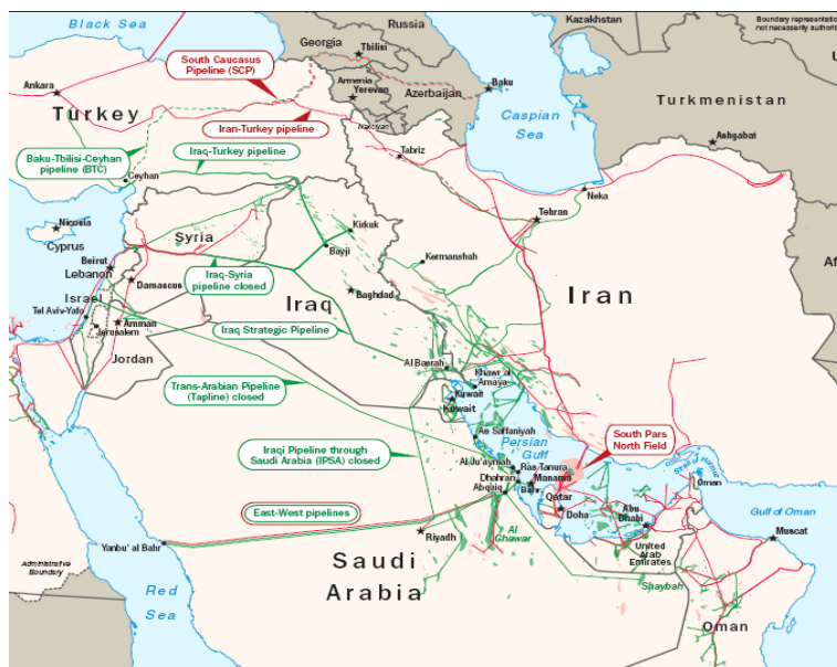
نقشه ۳: ذخایر نفت و گاز خلیج فارس (EIA, 2008, 1)

آن، از دیرباز مورد توجه قدرت‌های جهانی بود و تلاش برای اعمال سلطه و حفظ نفوذ در این منطقه به یکی از سیاست‌های راهبردی آنها تبدیل شده است.