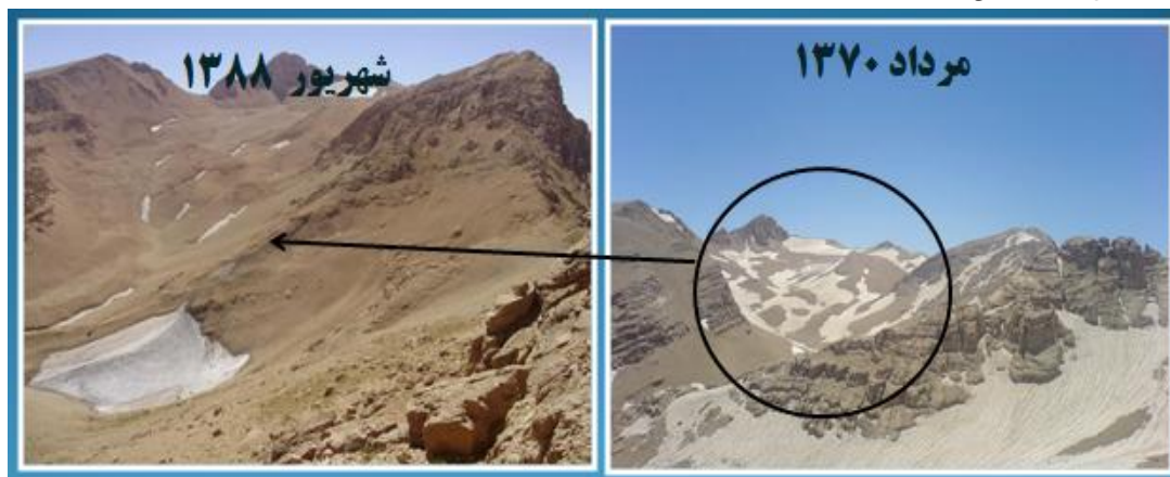
شکل ۱) تفاوت سطح در بخشی از یخچال های اشتران کوه در مرداد ۱۳۷۰ و شهریور ۱۳۸۸ (مؤسسه تحقیقات آب، ۱۳۸۸)

در این خصوص توسط Mousavi و همکاران (۲۰۰۹، ۹۳)، انجام شد که در آن از تصاویر ماهواره ای استفاده گردیده است. این محققین فهرست برداری جدیدی از یخچال های کشور ارائه دادند که نهایتاً سطح کل را حدود ۲۷ km ۲ محاسبه نمودند. وجود اختلاف در سطوح اعلام شده تا حدی به این دلیل است که بخشی از یخچال های کشور در زیر واریزه ها مدفون هستند که اندازه گیری آنها را با مشکل مواجه می کند. از سوی دیگر زوال آنها در فاصله زمانی دو تحقیق می تواند عامل دیگری باشد که در گزارشات مختلف به آن اشاره شده است (Ferrigno, ۱۹۹۱ و وزیر، ۱۳۸۲).