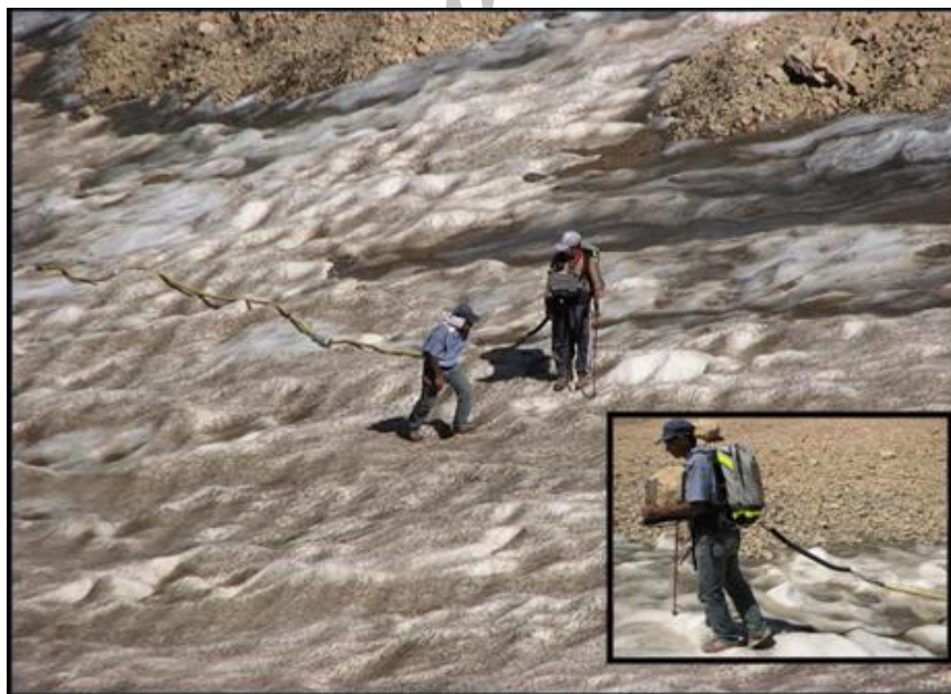
شکل ۲) عملیات عمق سنجی مؤسسه تحقیقات آب در بخشی از یخچال های زردکوه در شهریور ۱۳۸۹

حجم این یخچال ها با استفاده از اطلاعات جمع آوری شده از سطح آنها و بر اساس روابط تجربی ذکر شده در بخش ۲-۳ برآورد شد، که نتایج در شکل (۳) قابل مشاهده هستند. ملاحظه می گردد که نتایج حاصل از روش Bahr و همکاران (۱۹۹۶، ۲۰۳۵۵)، بیشترین شباهت را با اندازه گیری های انجام شده دارد، ضمن اینکه بیشترین مقدار را هم برآورد می کند. برتری این روش در تحقیقات مشابه برای یخچال های آلپاینی و نیمه آلپاینی نیز تأیید شده است (Farinotti et al., ۲۰۰۹, ۲۲۵).