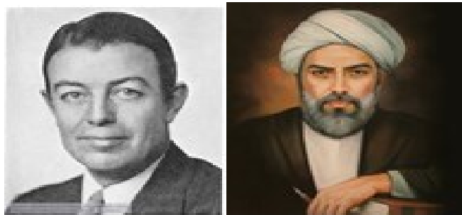
شکل ۲- الف، صدرالمتالهین ب، بنجامین لی ورف

ورف معتقد است هر جامعه‌ای می‌تواند دستگاهی زبانی و فرهنگی را شامل شود که نوع فهم و ادراک آن جامعه از محیط و جهان به آن بستگی خواهد داشت.