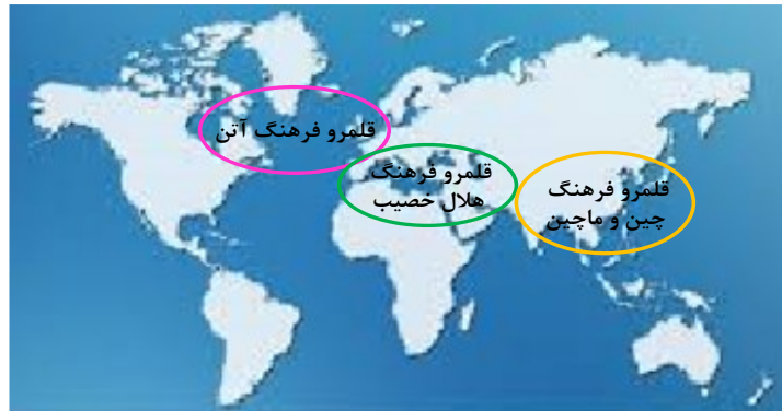
شکل ۱- تقسیم‌بندی یوستین اگارد از قلمروهای دانش

به این پرسش به وجود آمده و بیانگر این فهم است که به صورت اجمالی حوزه مدنی ایرانی‌ها با حوزه تمدنی آتن ۱ متفاوت است (شکل ۱) و چون سرزمین و جهان‌بینی آن‌ها متفاوت است، لذا الگوی توسعه آن‌ها نیز متفاوت خواهد بود زیرا نگاه ایرانیان به مسئله سعادت بشری با آن‌ها همسان نیست. اکنون به‌طور قاطع می‌توان گفت، ایرانیان به صورت اجمالی می‌دانند که نسبت آن‌ها با جوامع پیشرفته امروزی چیست؟ و جهان آن‌ها با جهان‌بینی حوزه تمدن آتنی چه تفاوتی دارد و تاریخ و هویت سرزمینی‌شان چه نقشی در این افتراق‌ها بازی کرده و می‌کند.