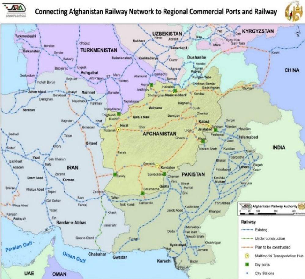
شکل ۲) راه‌های تجاری و راه‌آهن‌های منطقه (ایران تا چین) [Recca, 2019]

منافع ترانزیتی بیشتر به ویژه با عنایت به اقتصاد فعال و گسترده چین و اروپا برای همه کشورهای منطقه به وجود خواهد آمد.