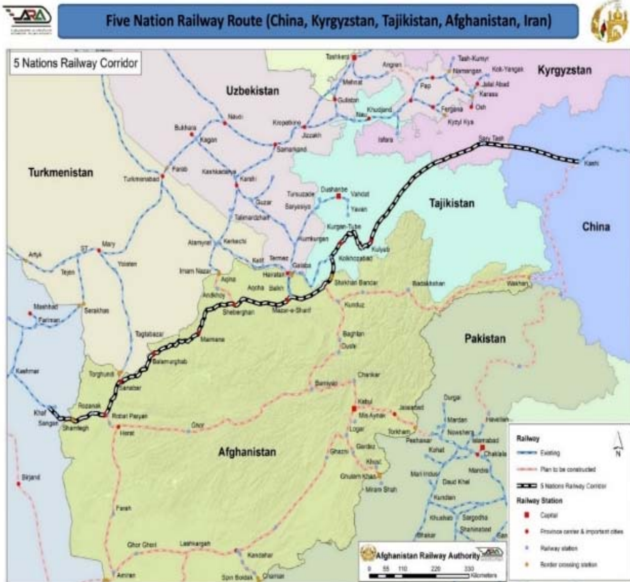
شکل ۳) مسیر راه‌آهن جمهوری اسلامی ایران- افغانستان- تاجیکستان- قرقیزستان- چین (خواف-کاشغر) [Recca, 2019]