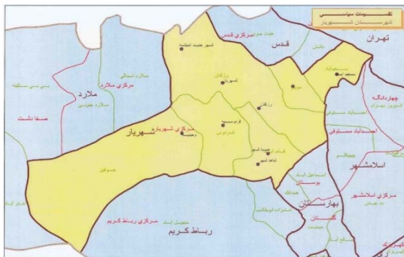
شکل ۳) نقشه تقسیمات سیاسی شهرستان شهریار (Ministry of Interior, 2016)

بنابراین، راهبردهای پهنه برای این شهرستان در قالب راهبردهای تدافعی قابل طراحی است.