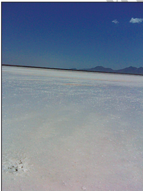
شکل ۱- تصویری از ساحل دریاچه ارومیه، موقعیت عکس‌برداری: UTMx: 523853, UTM y: 4180012, تاریخ عکس‌برداری: ۱۳۹۱/۳/۱۴.

آنچنان که از مطالب گفته شده بر می‌آید شوری و توزیع بیش از حد طبیعی نمک در محیط زیست اثرات سوء زیادی دارد. با خشک شدن دریاچه ارومیه و به وجود آمدن کویر نمک منطقه بسیار وسیعی تا مرز کشورهای همسایه و شاید فراتر از آن نیز تحت تأثیر قرار خواهند گرفت. برای جلوگیری از خطرات ناشی از شوری بهتر است ابتدا مناطقی که پتانسیل شوری‌زایی در آنها بالاست را مشخص کرده و با برنامه‌ریزی‌های بهینه خطرات زیست محیطی ناشی از شوری را به حداقل رسانند.