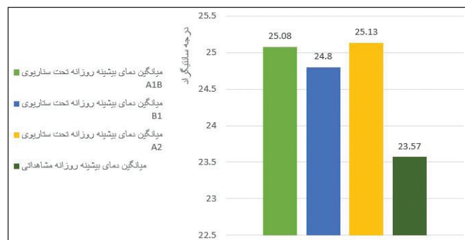
شکل ۳- مقایسه میانگین دمای بیشینه روزانه