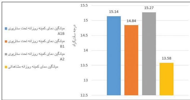
شکل ۲- مقایسه میانگین دمای کمینه روزانه

سانتی‌گراد افزایش دما می‌تواند وجود داشته باشد، در بدبینانه‌ترین سناریو (سناریو A2) نیز، میانگین دمای بیشینه روزانه ۱/۵۶ درجه سانتی‌گراد می‌تواند افزایش یابد. مطابق با مدل‌سازی تغییر اقلیم صورت گرفته در تحقیق، مشاهده می‌شود که به طور کلی بالا رفتن میانگین دما و کاهش میانگین بارش در اثر تغییر اقلیم، تحت هر سه سناریو محتمل است. همچنین در ابتدای تحقیق ذکر شد که عوامل به وجود آورنده تغییر اقلیم به دو دسته کلی عوامل طبیعی و انسان‌ساز تقسیم بندی می‌شوند.