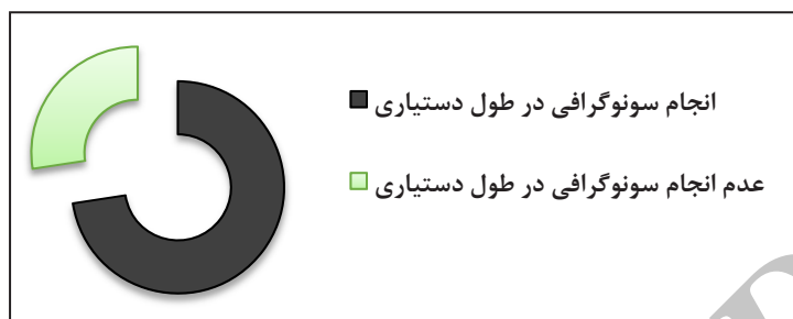
نمودار ۱- انجام سونوگرافی مستقل توسط دستیاران زنان

در پرسشنامه های ارسالی ۱۵۳ نفر از پاسخ دهنده ها در سال سوم دستیاری و ۱۵۷ نفر در سال چهارم دستیاری بوده اند. از مجموع ۳۱۰ پاسخ دهنده، ۲۲۵ نفر بیان داشتند که در طول دوره دستیاری به طور مستقل سونوگرافی انجام داده و ۸۵ نفر به این سوال پاسخ منفی داده اند. حدود ۷۵ درصد دستیاران پاسخ دهنده در طول دوره دستیاری انجام سونوگرافی به طور مستقل را داشته اند