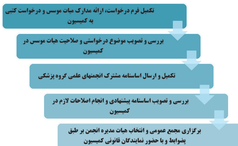
شکل شماره ۱: مراحل تاسیس انجمن‌های علمی

انجمن‌های علمی و سایر گروه‌های دانش محور فعال در عرصه علوم پزشکی، به عنوان بازوی مشورتی نظام سلامت کشور بوده که در تحقق اهداف برنامه‌های این حوزه نقش چشمگیری و حائز اهمیتی داشته است. از جمله این انجمن‌ها، انجمن‌های گروه علوم پزشکی است که بطور روزافزون شاهد رشد کمی و کیفی آن بوده ایم، بطوریکه ارتقای جایگاه و توجه ویژه به آنها به عنوان سازمان‌های مردم نهاد علمی در این عرصه قابل ملاحظه می‌باشد.