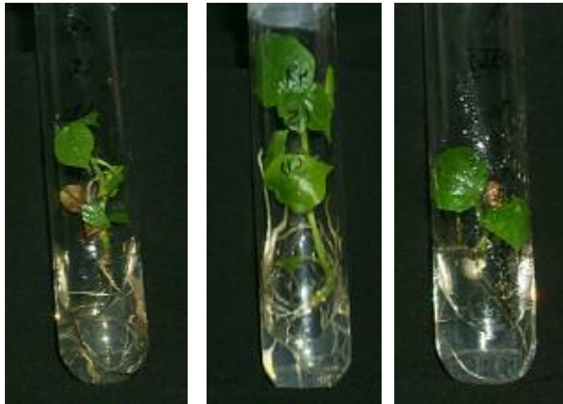
شکل ۴. گیاهچه های ریشه‌دار شده ۶۰ روز بعد از کشت در محیط ریشه‌زایی