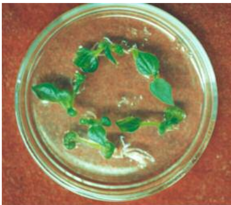
شکل ۳ ب. گیاهچه‌های باززاشده از مریستم همراه پریموردیا ۴۵ روز بعد از کشت در محیط ساقه دهی