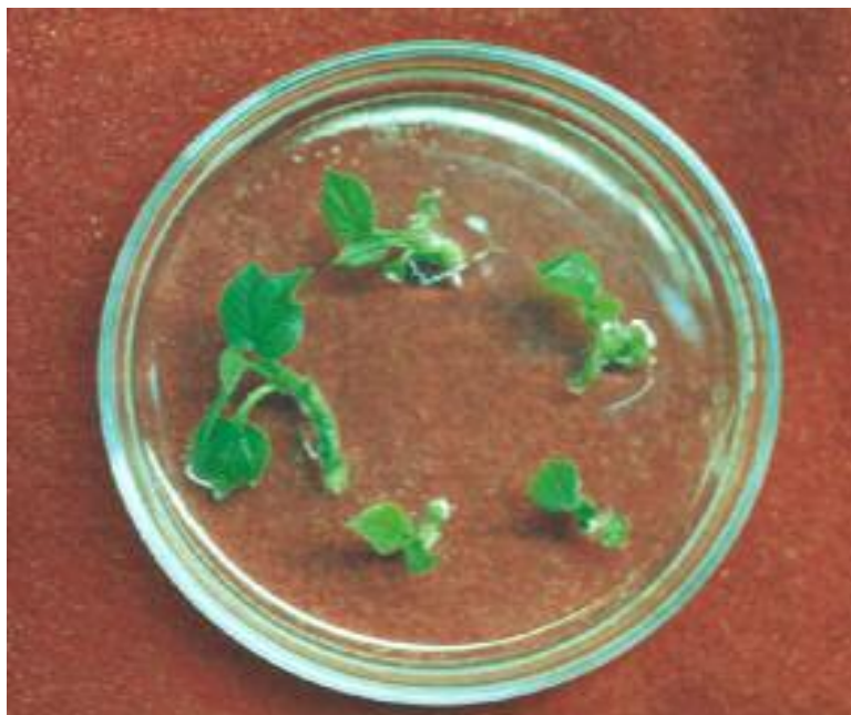
شکل ۳ الف. گیاهچه‌های باززاشده از مریستم ۴۵ روز بعد از کشت در محیط ساقه دهی