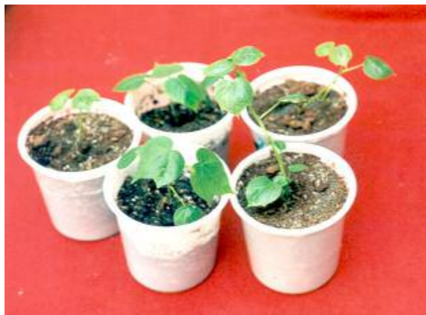
شکل ۵. گیاهچه‌های باززاشده انتقال یافته به گلدان

درصد و ۵ درصد) بیشتر بود و تفاوت معنی‌داری در درصد ریشه‌زایی بین دو محیط کشت MS_1 و MS_2 دیده نشد (جدول ۳). هم‌چنین مدت زمان مورد نیاز برای ریشه‌دار شدن در محیط کشت بدون تنظیم‌کننده رشد حدود دو ماه و نیم بود در محیط کشت حاوی تنظیم‌کننده رشد IBA حدود دو ماه می‌باشد. این نتایج نشان داد که احتمالاً تنظیم‌کننده رشد IBA در غلظت ۰/۱ میلی‌گرم در لیتر برای دو رقم ساحل و ورامین به‌عنوان تحریک