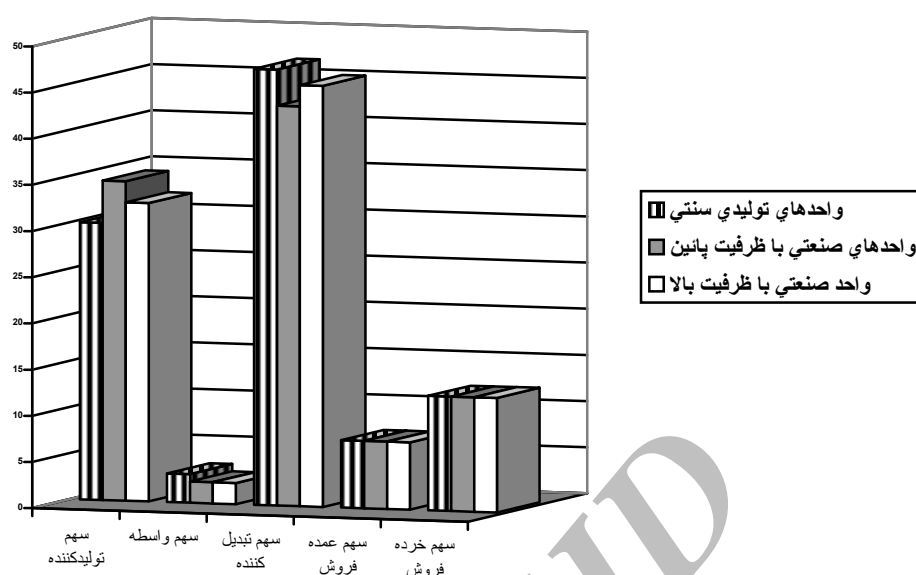
شکل ۲. مقایسه سهم هر یک از عوامل بازاریابی گل محمدی در تولید گلاب در واحدهای سنتی و صنعتی