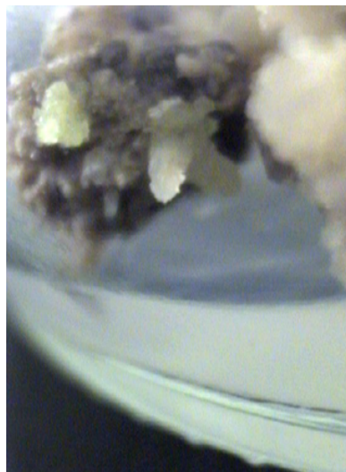
شکل ۳. ایجاد نوساقه در کالوس‌های یونجه در محیط کشت M12