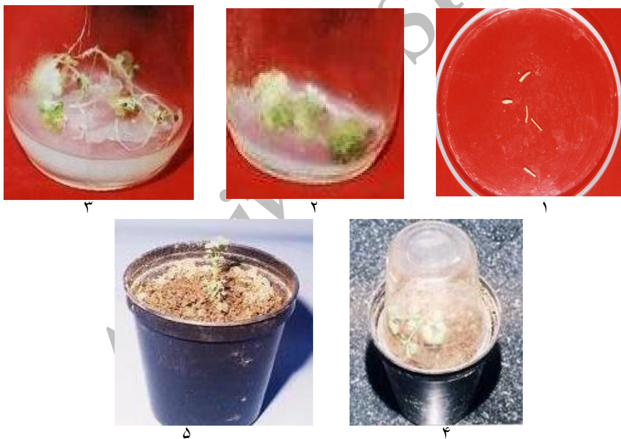
شکل ۴. مراحل مختلف باززایی گیاه یونجه از طریق ایجاد جنین سوماتیک