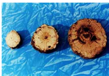
شکل ۳. نمونه‌هایی از مقاطع صیقل داده شده گون گزی که مقطع سمت راست حدوداً دارای سن ۷۰، مقطع وسطی حدود ۴۰ و مقطع سمت چپ حدود ۲۰ سال می‌باشد.

پوشش، سن گیاه و رطوبت محیط بررسی شود تا نقش آن مشخص گردد.