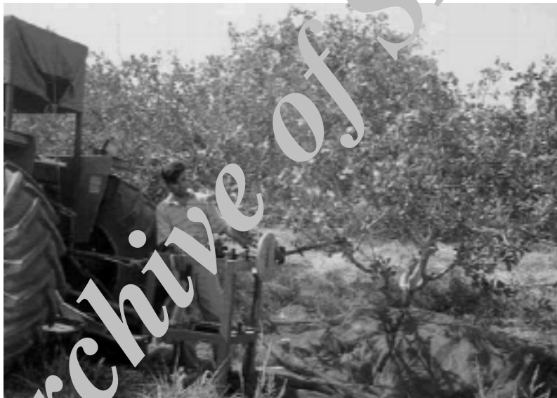
ب) تصویری از دستگاه شاخه تکان در حال ارتعاش شاخه

شکل ۱. تصاویری از مکانیزم انتقال حرکت و نحوه اتصال دستگاه شاخه تکان به هنگام اجرای آزمونها