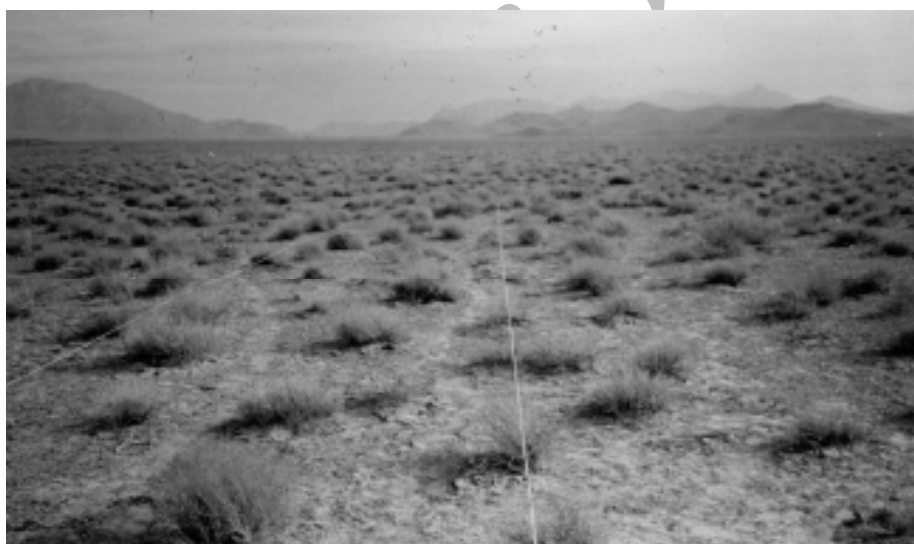
شکل ۳. منطقه حسن آباد ندوشن یزد

می‌باشد. تیپ گیاهی این منطقه Ar. As می‌باشد. این منطقه با وسعتی معادل ۵۸۱۷ هکتار بر روی دشت سرهای لخت و اپانداژ با حدود ارتفاعی ۲۴۰۰ متر قرار دارد. نوع خاک لومی شنی، اقلیم خشک سرد و میانگین بارندگی در حدود ۲۰۰ میلی‌متر می‌باشد (۱) (شکل ۴).