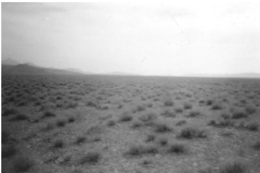
شکل ۴. منطقه صدرآباد ندوشن یزد

کوادراتی محاسبه شده در سطح احتمال ۵ درصد با استفاده از تست آماری مربوط به همان شاخص آزمون شد تا اختلاف هر یک از پراکنش تصادفی مشخص گردد (۱۰). برای مقایسه شاخص های الگوی پراکنش از نظر دقت، از طرح کاملاً تصادفی و جدول تجزیه واریانس استفاده شد، بدین ترتیب که واریانس بین ۱۲ عدد به دست آمده از هر شاخص در سه منطقه محاسبه و سپس (MSE) میانگین مربعات خطای آزمایشی و (SE) خطای استاندارد برای هر شاخص محاسبه گردید.