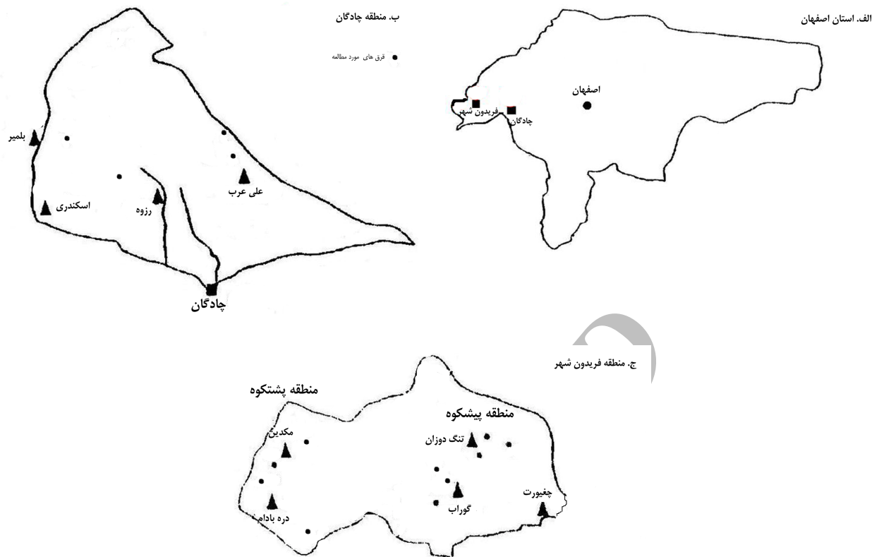
شکل ۱. موقعیت مناطق در استان اصفهان (الف) و محل فرق های نمونه برداری شده در شهرستان های چادگان (ب) و فریدون شهر (ج)

درصد گوسفند، ۲۰/۳ درصد بز و ۵ درصد گاو می باشد (۳). آمار رسمی نشان می دهد ۲۲/۸ درصد از جمعیت عشایری دارای پروانه بهره برداری از مرتع در دهستان پشتکوه قرار داشته و ۴۵/۸ درصد دام عشایری موجود در بخش فریدون شهر را دارا می باشند. شدت چرا در این منطقه ۰/۶۸ واحد دامی در هکتار می باشد. در صورتی که تنها ۱۷ درصد جمعیت عشایری و ۱۳ درصد دام عشایری موجود در بخش در منطقه پشتکوه چرا می نمایند و شدت چرا ۰/۳۸ واحد دامی در هکتار می باشد (۳). به نظر می رسد آمار واقعی بیش از این بوده و به طور کلی ۳۰ تا ۴۰ درصد دام موجود در این مناطق مازاد بر ظرفیت مراتع باشند (۳).